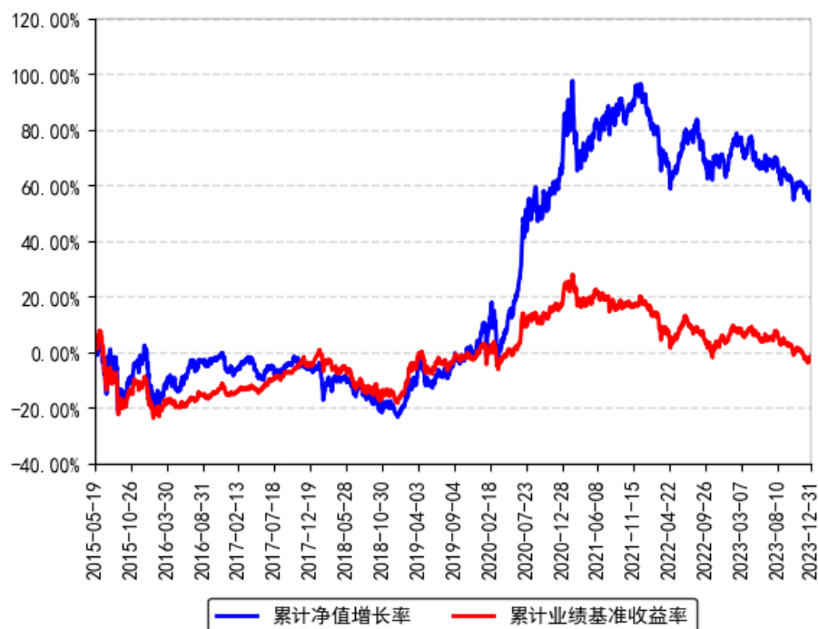
南方改革机遇灵活配置混合累计净值增长率与同期业绩比较基准收益率的历史走势对比图