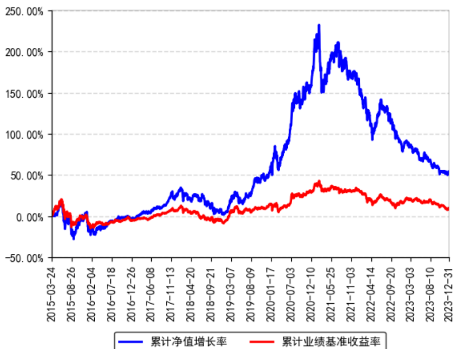
南方创新经济灵活配置混合累计净值增长率与同期业绩比较基准收益率的历史走势对比图