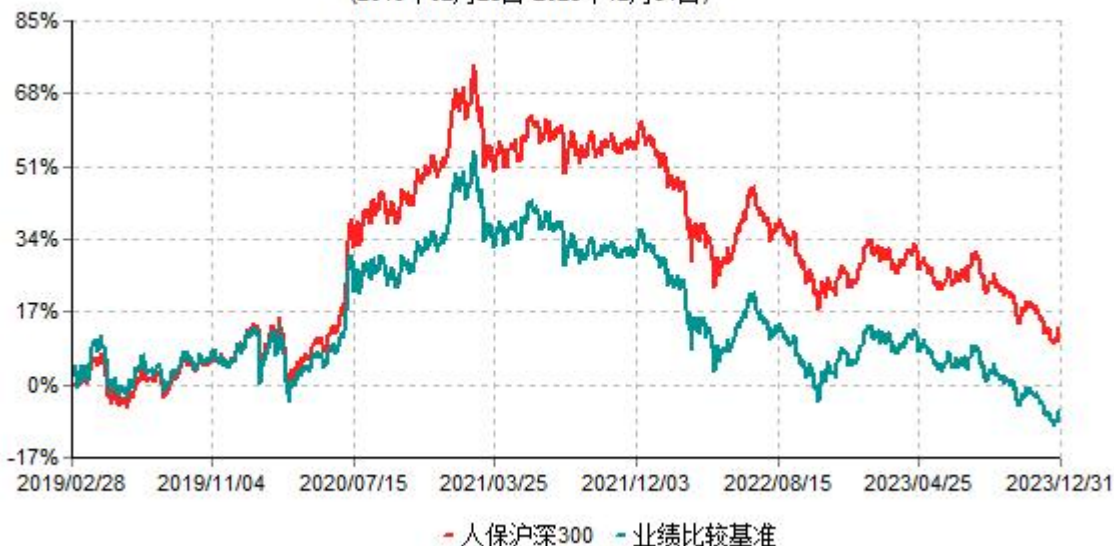
人保沪深300指数型证券投资基金累计净值增长率与业绩比较基准收益率历史走势对比图 (2019年02月28日-2023年12月31日)

注：1、本基金基金合同于2019年2月28日生效。根据基金合同规定，本基金建仓期为6个月，建仓期结束，本基金的各项投资比例符合基金合同的有关约定。