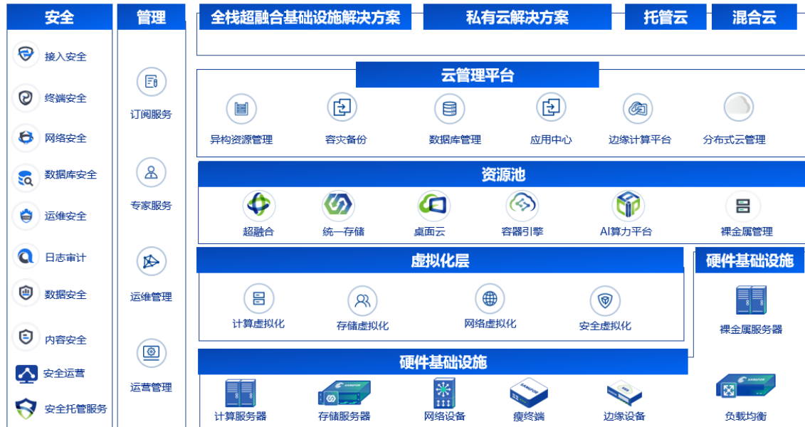
图 2：“信服云”架构全景图

决方案和服务。面对不断变化的市场竞争环境，公司始终坚持持续创新的发展战略，不断更新迭代既有产品和解决方案，并孵化培育新兴产品及服务，完成从过去的超融合承载业务向数据中心全面云化的转变。自 2013 年开始，公司云计算及 IT 基础设施业务已陆续推出虚拟化产品、超融合 HCI 产品、云计算平台 SCP、企业级分布式存储 EDS、软件定义终端桌面云 aDesk、数据库管理平台 DMP 等多款创新产品，并向用户提供包括托管云、私有云等云数据中心方案。