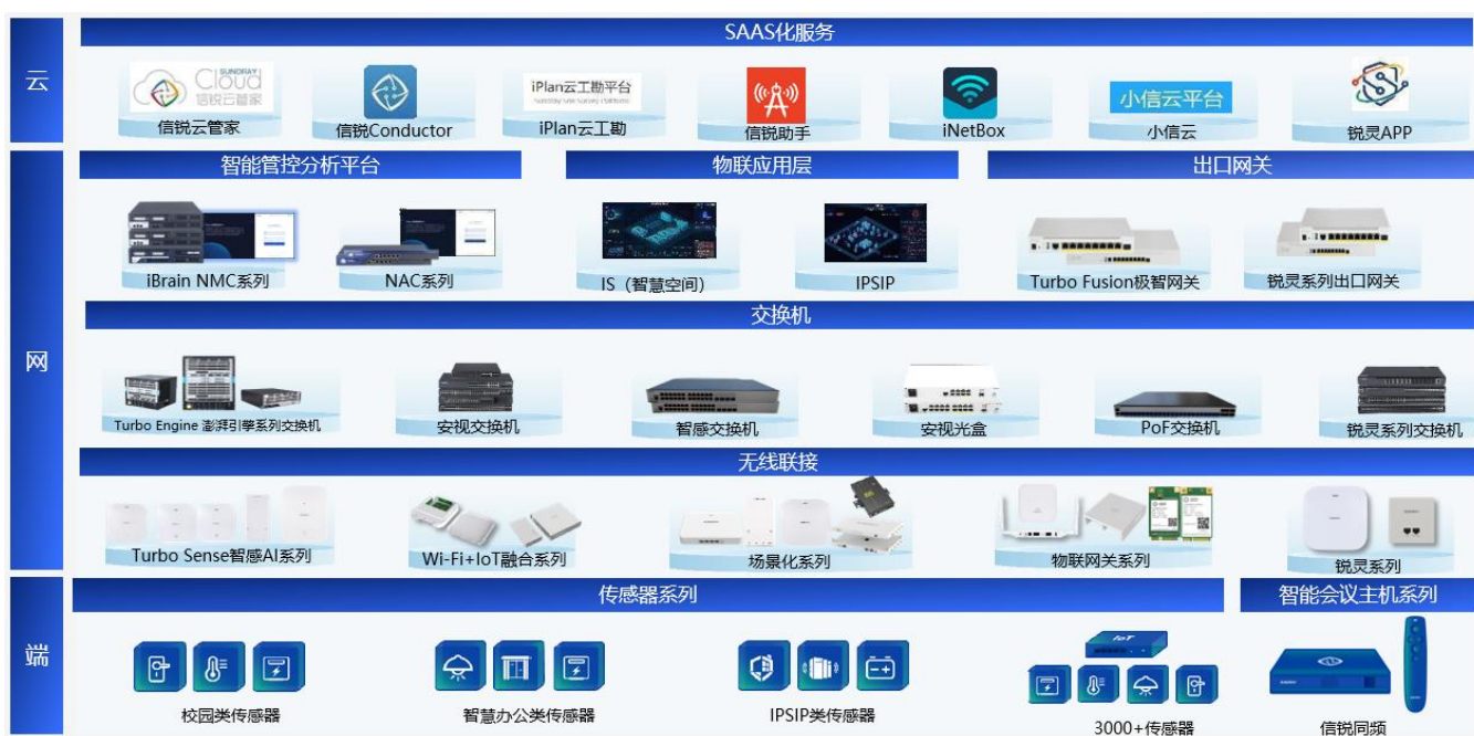
图 3：信锐网科产品矩阵

公司基础网络与物联网业务的经营主体为子公司信锐网科，其产品包括企业级无线、安视交换机、企业级物联网和面向中小企业的 SMB 数通组网产品，致力于为各行各业用户的数字化转型提供面向未来的网络联接产品及解决方案。其中，企业级无线业务提供全场景无线接入、无线网络安全、无线大数据分析等方案；安视交换机业务提供从接入、汇聚到核心等数字化升级改造的全场景有线安全接入方案；企业级物联网业务提供物联网校园、泛机房动环检测、智慧办公等智能化服务；SMB 数通组网产品提供组网“三件套（网关、交换机、无线接入点 AP）”和“一平台（云平台）”的中小组网产品及服务。