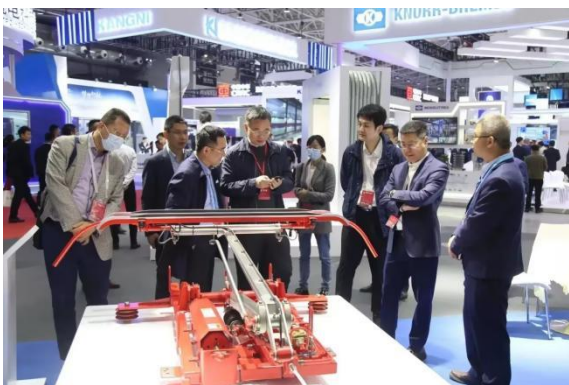
青岛国际城市轨道交通展览会

展会作为展示产品、拓展市场、促进销售的重要平台，同时也是企业与客户互动关键平台。在展会期间，企业的每一个行为和决策都会受到客户和潜在客户的密切关注。2023年公司通过参加青岛国际城市轨道交通展览会、德国慕尼黑新能源车展览会、2023年俄罗斯国际铁路展览会等，与客户和潜在客户密切交流，通过积极主动地保护客户权益，例如提供准确的产品信息、透明的价格政策、优质的服务体验等，赢得客户的信任和认可，进而提升企业的声誉和形象。