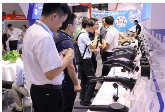
慕尼黑上海电子展