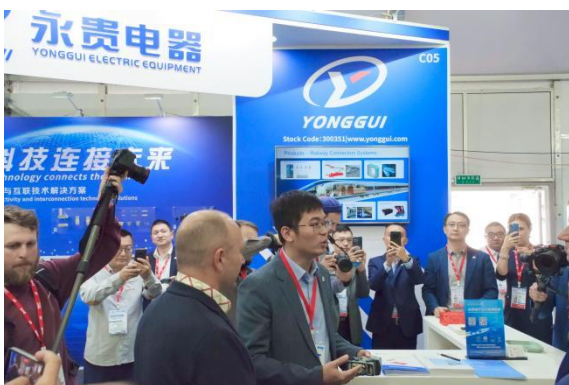
2023年俄罗斯国际铁路展览会