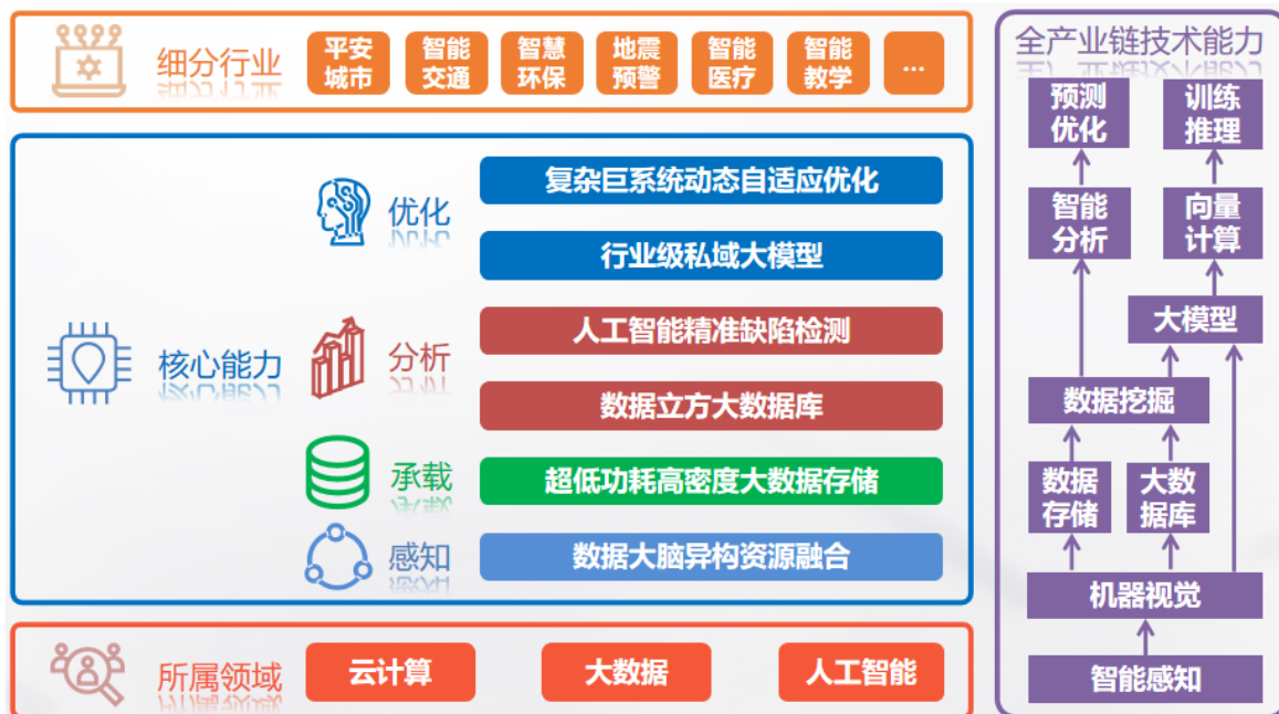
云创数据整体业务体系架构图

优化于一体的全产业链核心技术能力，公司的核心优势在于“算法+模型库”的智能成长模式，以算法生成模型，由模型验证算法。最终，构建出具有特色和竞争力的核心产品体系，面向不同市场领域客户提供完整的大数据存储与智能处理解决方案。