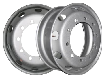
图2：轻量化无内胎钢轮（适用于轻量化商用车型）