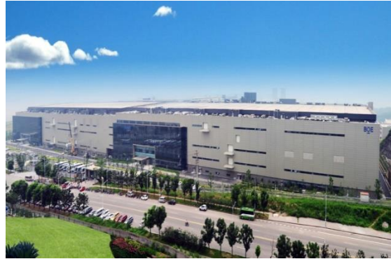
图6：NCC钢结构应用于高端电子厂房