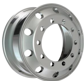
图3：锻造铝合金轮毂（适用于高端商用车型、新能源车型、特种车辆）