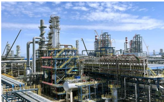
图9：NCC钢结构应用于石油化工领域