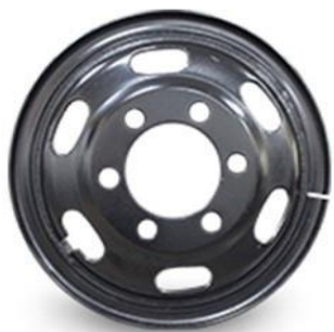
图1：型钢钢轮（适用于特殊路况重载车型）