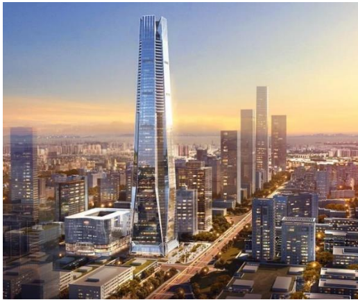
图7：NCC钢结构应用于超高层建筑