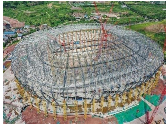
图8：NCC钢结构应用于体育场馆