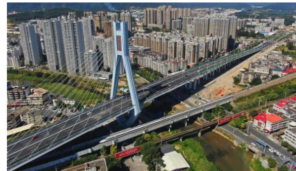
图10：NCC钢结构应用于公路跨线桥