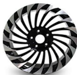
图4：乘用车锻造铝轮（新开发产品，适用于改装车）