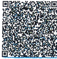
须更新的年检二维码

本证书经检验合格，继续有效一年。 This certificate is valid for another year after this renewal.