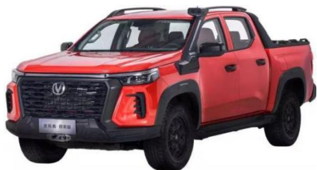
长安开拓者·探索版

长安开拓者·探索版，定位“运动型越野皮卡”。拥有 2.0T 蓝鲸动力，采埃孚 8AT 变速箱，博格华纳四驱系统，五种自由驾驶模式，同时配备了高性能越野运动悬架，全地形锁止系统，18 寸全地形越野胎，最大 800mm 高位涉水喉，14,000 磅电动绞盘，2.5 吨拖拽资质，将为勇于探索、饱含热爱的用户实现所向往的皮卡生活。