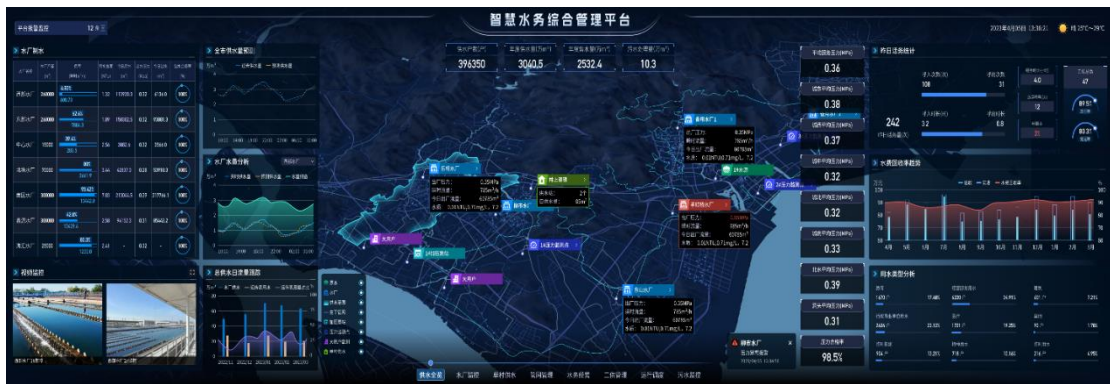
智慧水务综合管理平台

公司数字水务解决方案同样采用云-管-端的服务架构，涵盖水务场景下的智能终端感知、智能网络传输、智能数据采集和智慧业务运营，并一直延伸到 C 端用户的智慧服务。目前公司已经开发了各类民用和工商业智能水务终端，利用机电转换、超声传感和电磁传感等技术产生业务源数据，通过NB-IoT网络将海量业务数据汇集于IoT大数据平台，用于水务企业客户服务、运行调度、漏损治理、数据驾驶舱等各项应用功能。目前数字水务整体解决方案主要包含数字水务一体化整体解决方案、DMA分区漏损控制解决方案、二次供水综合解决方案、农饮水一体化整体解决方案，助力水务企业更高效运营、更科学管理、更优质服务。