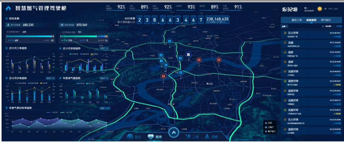
智慧燃气管理驾驶舱