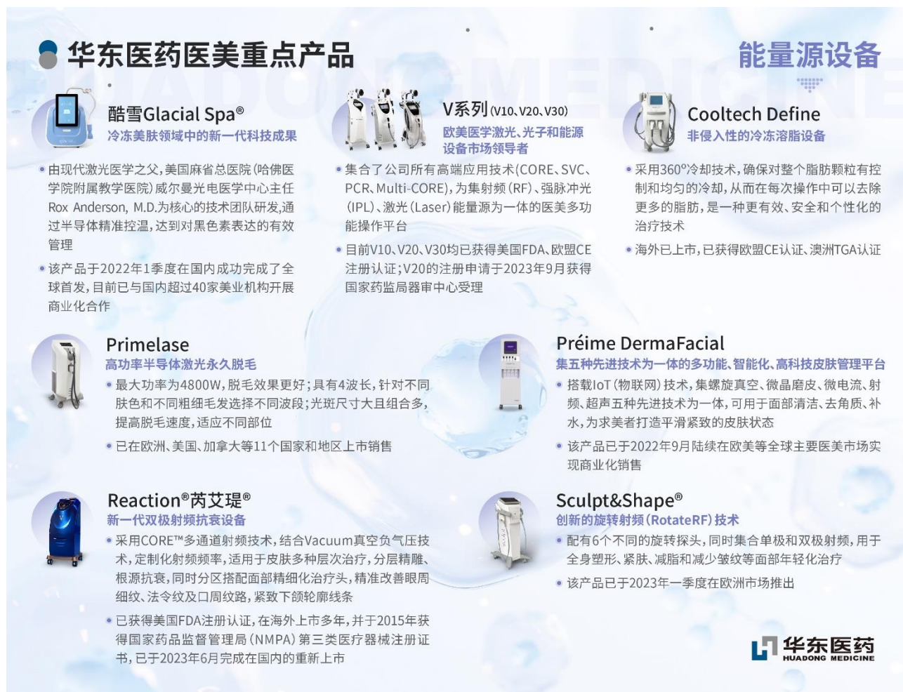
图：华东医药医美重点产品

报告期内，欣可丽美学以公司品牌为主体，带动旗下子品牌协同发展，在进入中国市场后打造多个明星项目，联动全球资源，强化在 B 端以及 C 端的知名度，建立“专业”、“美学”、“高端”的品牌形象。其中核心产品 Ellans e®伊妍仕®作为中国医美市场唯一一款欧洲进口的再生型填充剂，以其独特的 PCL+CMC 的王牌抗衰组合，为求美者带来自然塑颜的抗衰效果，深受市场认可。截至 2023 年底，Ellans e®伊妍仕®官方合作医院数量已超 600 家，培训认证医生数量超过 1100 人。Ellans e®伊妍仕®通过品牌跨界影响活动，持续强化品牌建设，夯实高端定位，深受 C 端市场认可，行业影响力和竞争力不断提升。