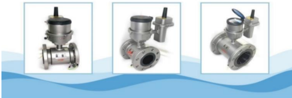
电磁水表实物照片

②电磁水表。电磁水表是一种根据法拉第电磁感应定律来测量管内水流量的感应式计量仪表。与传统机械计量水表比较，电磁水表具有零磨损、低压损、宽量程、高灵敏度、易实现功能扩展等优点。例如可以选配压力传感器，检测安装点管道压力；采用 NB 或 GPRS 数据远传，实现远程抄表。该产品特别适用于管网监测和 DMA 分区计量管理，帮助水司及时发现漏点、减少漏损、降低产销差率。