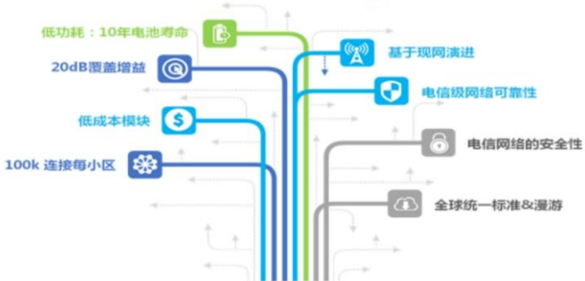
NB-IoT 水表关键技术优势

①NB-IoT 无磁远传水表。NB-IoT 无磁远传水表，是指采用 NB-IoT 通讯技术和无磁传感技术，实现数据远传的智能水表。其主要特点：①无磁传感：采用无磁传感技术，不受外界磁场干扰；②1L 计量：机电转换最小分辨率为 1L，便于做分区计量及用户漏损检测；③NB-IoT 通讯：采用 NB-IoT 无线通讯，安装方便，无需布线；④数据存储：每 30 分钟存储一次，可连续存储 31 天的实时流量数据，可保存最近 18 个月的月结流量数据；⑤低压检测：水表供电电池低压时会主动上报至管理系统，提醒管理人员更换合格电池。