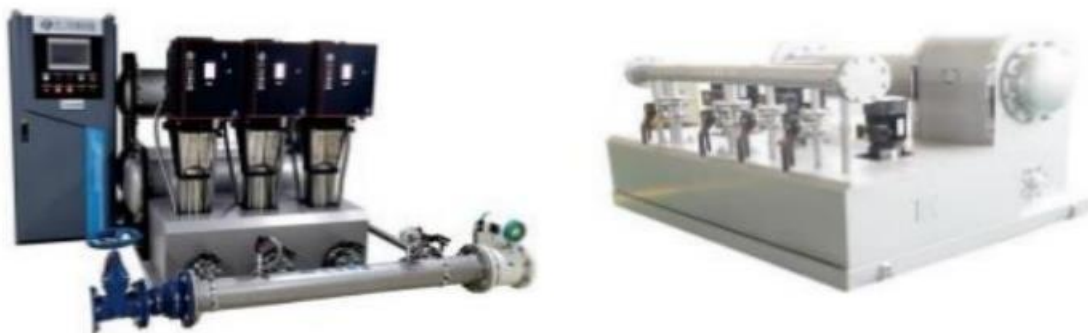
无负压供水设备实物照片

④无负压管网叠压稳流给水设备。即无负压供水设备，是一种加压供水机组，它直接与市政供水管网连接，在市政管网剩余压力基础上串联叠压供水，确保市政管网压力不小于设定保护压力的二次加压供水设备。主要用于高层供水，并配备监控系统，实现对供水机组的监测与控制，具有动态画面、状态监视、远程控制、报表处理、统计分析等功能。与传统的水池供水相比，无负压供水设备基础投资小，设备全封闭运行不会对水质造成二次污染，管网叠压及变频控制，用电节能 30%以上，属于绿色环保产品。