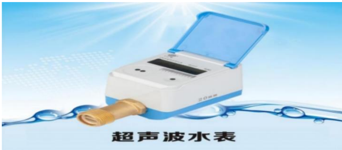
多感知超声波水表

水表。其主要特点：（1）超声波计量，计量精度高并可计量正、逆向流量；（2）集成水质传感器、温度传感器、压力传感器，可实时判断当前水质的优劣，对超低或超高水温进行预警，对管网压力进行检测，及时发现爆管或渗漏事故；（3）数据海量存储，可循环存储 120 月结数据、120 天日结数据、50 条故障记录、2000 条事件记录；（4）产品具有红外通讯接口，接受固件升级，也可通过通信网络实现远程升级。