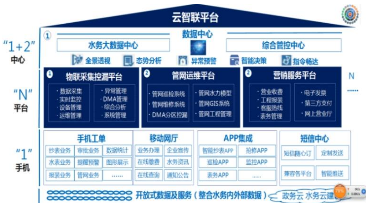
智慧水务云平台架构图

协议的水表，消除烟囱式系统和数据孤岛，帮助水司实现生产调度（水质管理、二次供水、水厂工艺实时监测）、客服营销（智能抄表和收费系统）、运营管理（GIS 系统、外勤系统、工程管理）和定量控漏（DMA 分区计量、渗漏预警管理、压力调控管理）四大功能。