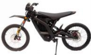
K2 ELECTRIC DIRT BIKE