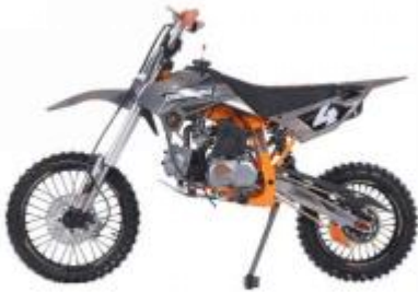
MX4 DIRT BIKE

2023 年，公司越野摩托车实现销售收入 12,256.03 万元，占营业收入比例为 5.72%，同比增长 303.21%。