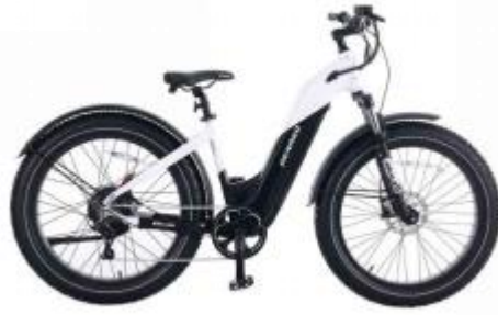
电动自行车DENAGO FAT TIRE