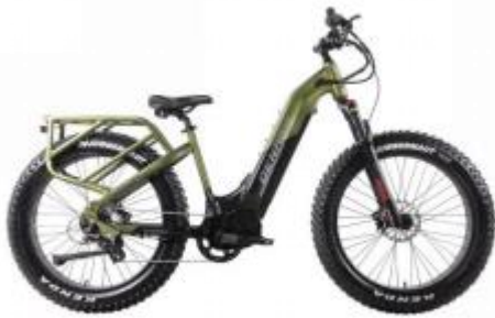
电动自行车DENAGO HUNTING 1