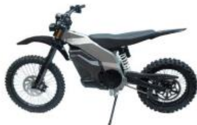
EVEREST ELECTRIC DIRT BIKE