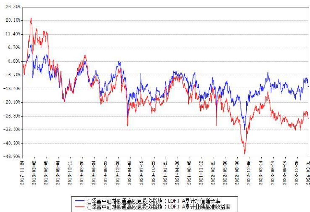
汇添富中证港股通高股息投资指数（LOF）A累计净值增长率与同期业绩比较基准收益率对比图