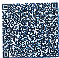
真实的年检二维码

本证书经检验合格, 继续有效。 This certificate is valid for another year after this renewal.