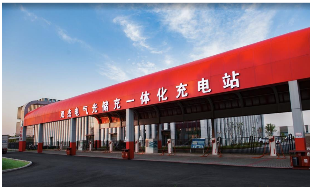
合肥光储充（换）一体化示范项目

公司统筹规划布局、科学分步实施，推进充换电站、分布式储能与光伏发电等解决方案技术融合，构建“光储充”一体化微电网系统，在交通领域全面电动化的背景下，推动“车-站-网”协同互动，打造具有核心竞争力的绿色综合能源服务平台，为用户带来更高效、更便捷的补能解决方案。