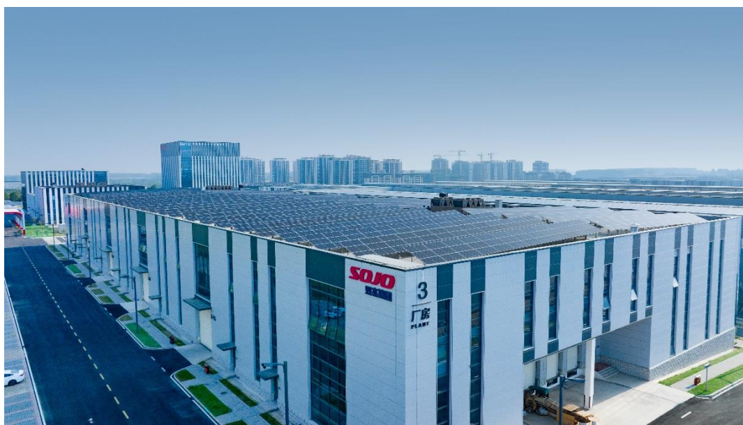
双杰合肥绿色低碳智慧工厂分布式光伏项目

公司的项目涵盖分布式光伏电站与集中式地面光伏及风电电站的投资、建设、运营，同时可为用户提供一站式新能源解决方案，助力企业降本增效。在分布式光伏电站方面，公司通过设立项目公司，深耕北京、山东等经济相对发达的地区，建设运营光伏项目，并以“自发自用、余量上网”的方式运行。在集中式地面光伏及风电电站方面，公司聚焦几大重要能源基地，并与当地产业就新能源开发建设达成深度合作共识。