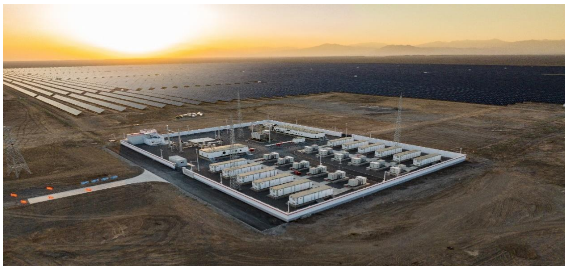
吐哈油田 120MW 源网荷储一体化项目

箱变、汇流箱、逆变器、升压逆变一体机等)，即对光伏电站及相关项目进行设计、采购、施工的一体化总承包。在前述业务模式下，双杰新能按照承包合同规定的总价或可调总价方式，以光伏监控运维平台和光伏项目管理平台作为业务支撑，对工程项目的进度、费用、质量、安全进行管理和控制，并按合同约定时间完成工程建设。双杰新能依托其在 EPC 项目实施和管理方面的优势以及电力行业积累的丰富经验，在实现项目成本和高质量控制的同时，能够有效带动公司箱式变电站、升压逆变一体机等配套电力设备的销售，促进公司业务高质量增长。目前公司光伏 EPC 业务主要涉及工商业分布式光伏、集中式光伏地面电站、户用光伏等。