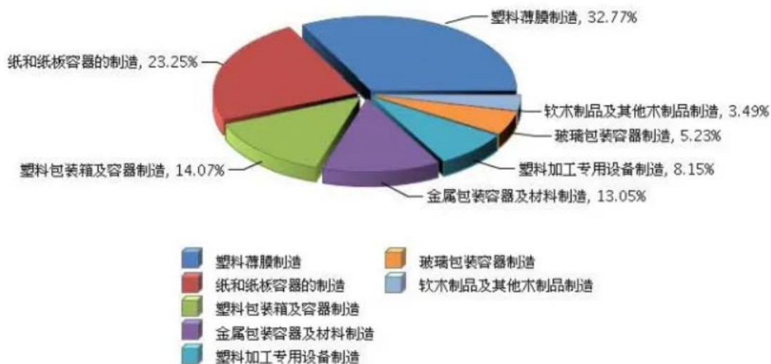
图 1 2023 年 1-12 月全国包装行业累计营业收入行业小类占比情况

根据中国包装联合会的分类统计，我国包装行业分为塑料薄膜制造、纸和纸板容器制造、塑料包装箱及容器制造、金属包装容器及材料制造、塑料加工专用设备制造、玻璃包装容器制造和软木制品及其他木制品制造等七小类。2023 年我国包装行业规模以上企业（年营业收入 2000 万元及以上全部工业法人企业）10632 家，累计完成营业收入 11,539.06 亿元，其中纸和纸板容器制造业 2991 家，累计完成营业收入 2,682.57 亿元，占比 23.25%；纸和纸板容器制造在行业小类中排第二，是包装行业的重要组成部分。