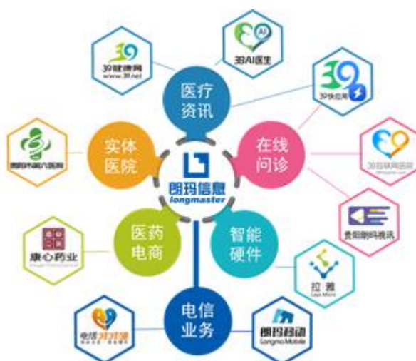
朗玛互联网医疗生态系统

报告期内，公司围绕年初制定的经营目标，继续深耕“互联网+医疗”，开展医学人工智能研发，推进线上互联网医疗服务+线下实体医院的医疗服务，电信及增值电信业务以创新业务发展、遵守行业监管为导向，各业务相互协作与协同发展，加速完善朗玛互联网医疗生态系统，提高综合竞争力。报告期公司各项业务稳步发展，实现营业收入 45,958.27 万元，同比增长 5.26%；实现归属于上市公司股东的净利润 7,745.71 万元，同比增长 10.19%；实现归属于上市公司股东的扣除非经常性损益后的净利润 7,414.50 万元，同比增长 10.04%。