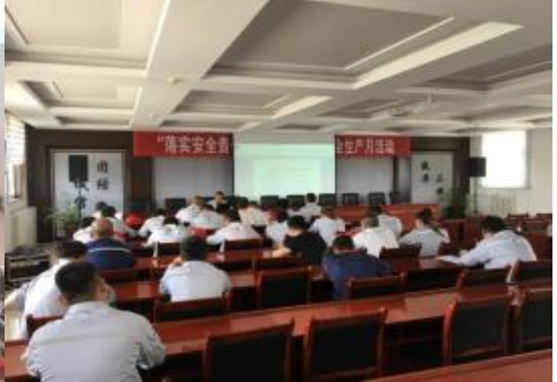
三聚家景组织开展落实安全生产责任培训活动