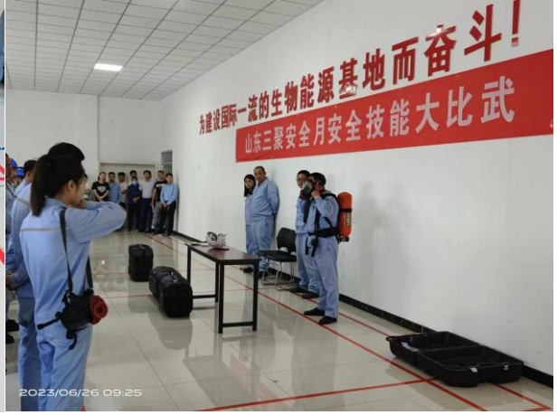
山东三聚安全生产月安全技能与急救培训