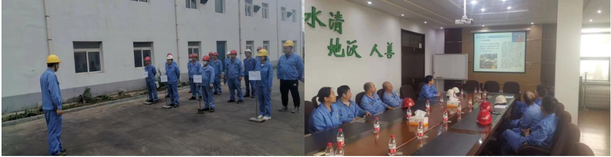
沈阳三聚组织安全月启动仪式及演练和培训活动

“安全生产月”活动期间，生产安全环保部组织公司员工开展了安全知识培训活动——安全知识线上答题及“安康杯”安全知识竞赛活动，提高了全体员工安全责任意识，牢固树立安全发展理念。