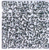
吴晓的年度检验二维码.png

本证书经检验合格，继续有效一年。 This certificate is valid for another year after this renewal.