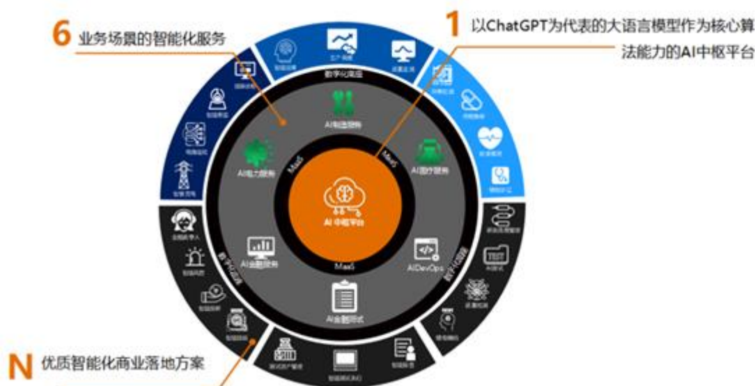
润和软件 AI 1+6+N 战略

2023 年公司发布了《润和软件人工智能（AI）战略白皮书》，重点提出了公司人工智能 1+6+N 发展战略：即 1 个 AI 中枢平台服务，6 个垂直领域智能化服务覆盖电力、医疗、制造、金融服务、金融测试、开发能效，N 个直击客户痛点、紧贴客户需求的智能化解决方案。