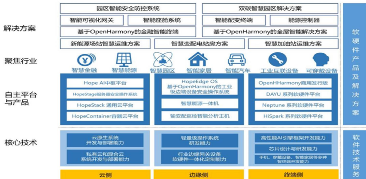
润和软件智能物联业务架构图

公司以自身在国产开源操作系统（OpenHarmony、openEuler）平台所积累的突出技术研发优势为核心，依托自身在芯片与终端设备开发、操作系统、中间件、边缘计算、云计算、大数据、人工智能等先进技术领域的长期实践积累，建立了从端到边到云、从底层技术到上层应用的物联网解决方案全栈技术能力，针对未来物联网发展所带来的大量行业定制终端及万物互联需求，不断推出多种软硬件产品，面向智慧金融、智慧能源、智慧城市、智慧医疗、工业互联、智慧教育、智慧园区、智慧商业等行业领域打造“云-边-端”高效、安全、协同的解决方案。