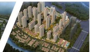
漳州保利世茂璀璨滨江二期项目