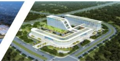
苏州市妇幼保健院项目