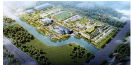
太仓市城东水质净化厂项目