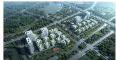
上海宝山MAX科技园项目