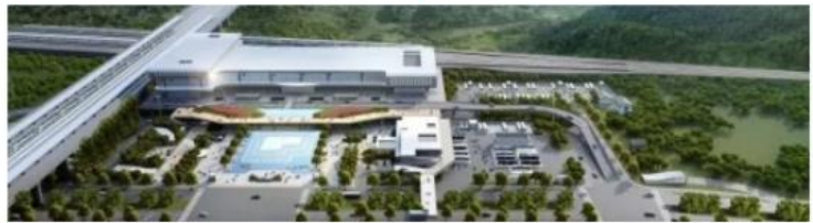
| 新建金甬铁路站前工程