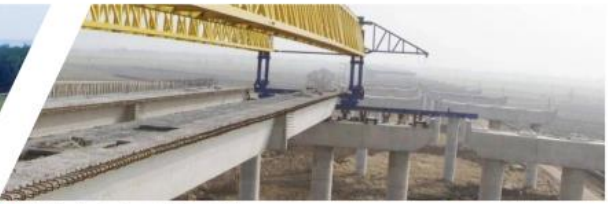
| 徽州大道南延工程(庐江段)