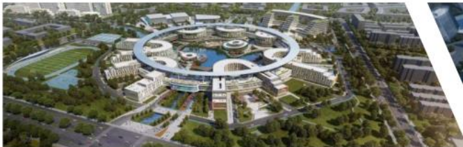
西交利物浦大学太仓校区项目