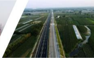
| 京沪高速改扩建Sy4标