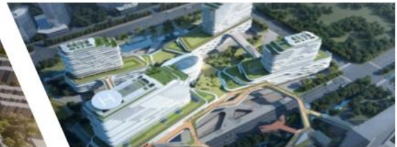
盐城市第一人民医院二期及医疗综合体