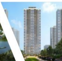
武汉航发星合世家项目