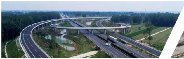
| 阜溧高速公路建湖至兴化段