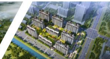
灌云万达广场泰达城