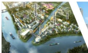
吴江桃源融创文旅城