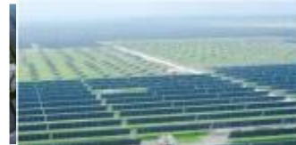
国家光伏·储能实证实验平台(大庆基地)一期工程项目