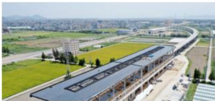
| 温州市域铁路S2线一期工程