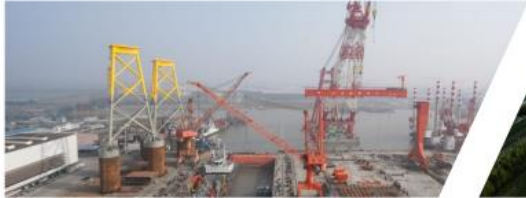
| 江苏海新船务重工有限公司轨道安装项目