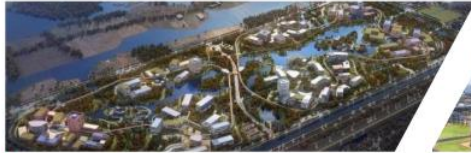
华为上海青浦研发生产项目