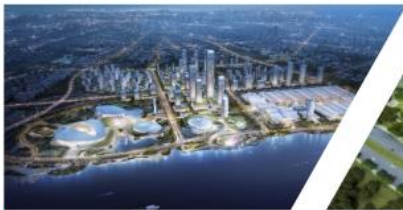
厦门新会展中心体育中心