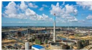
中科(广东)炼化一体化项目