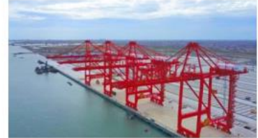
| 启东港区吕四作业区内河转运码头一期