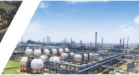
盛虹炼化一体化项目