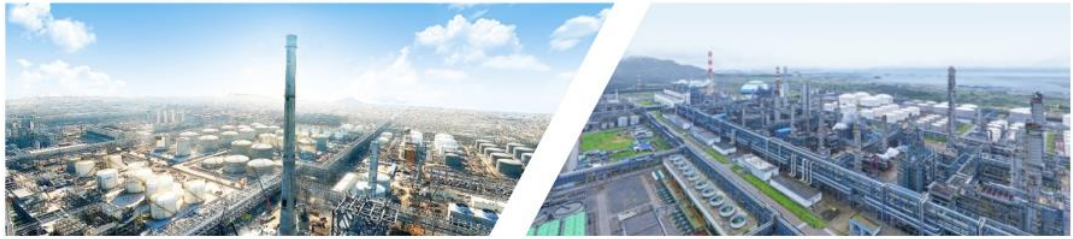
浙石化年产4000万吨炼化一体化项目