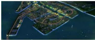
山东裕龙石化项目