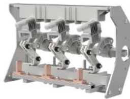
环网柜负荷开关单元开关