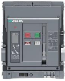
低压小型化框架式断路器