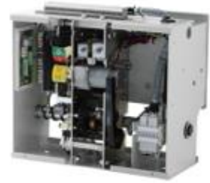
中压断路器操作机构