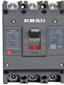
低压塑料外壳式断路器