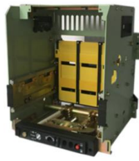
低压断路器框（抽）架