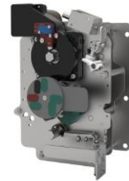
环网柜组合电器单元操作机构