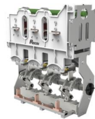
环网柜断路器单元开关