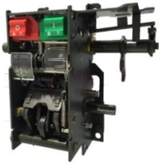
低压断路器操作机构