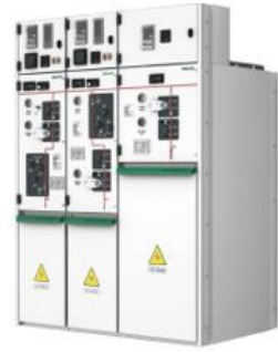
环保气体绝缘环网柜