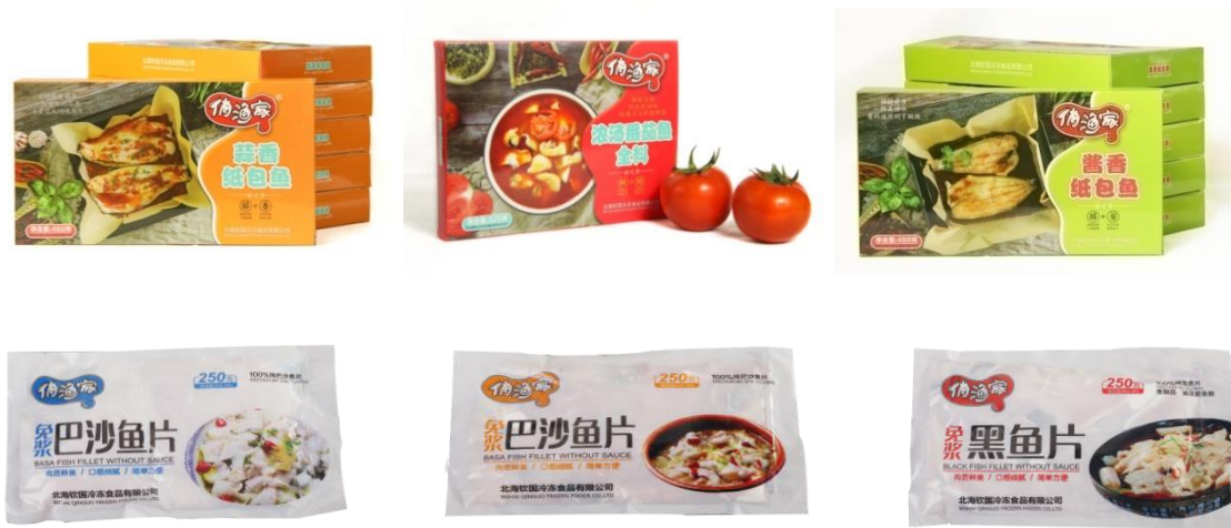
公司“俏渔家”品牌部分产品

“俏渔家”系列产品已拥有免浆带皮巴沙鱼片、免浆去皮巴沙鱼片、免浆黑鱼片、免浆鲷鱼片、青虾仁、水煮汉虾等品种。