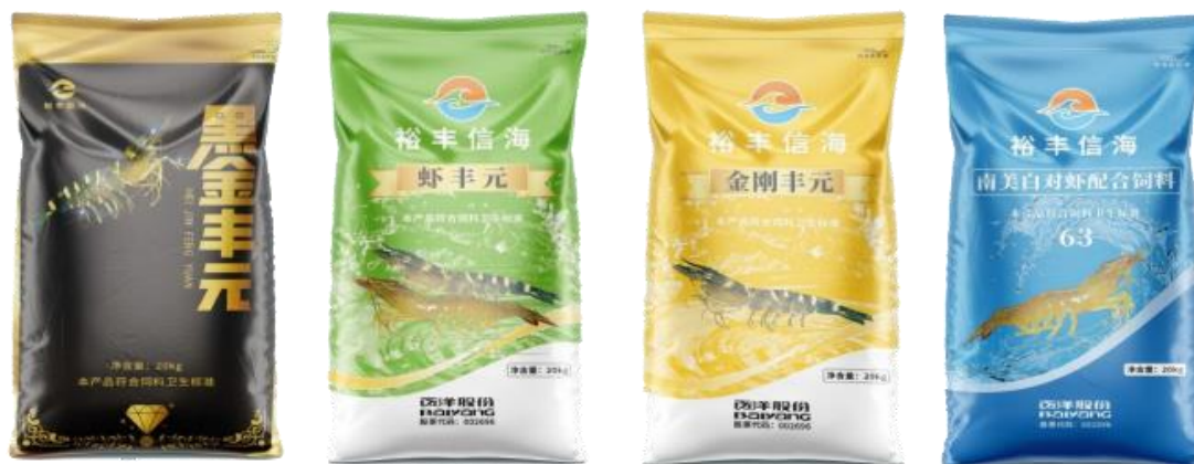
公司部分虾饲料产品

虾饲料产品是公司未来重点发力的产品品类之一。目前已开发出了“黑金丰元”、“金刚丰元”、“虾丰元”等一系列产品，能够满足金刚虾、白对虾、斑节对虾等不同虾种的养殖需求，能够适应高位池高密度养殖、土塘低密度养殖、土塘鱼虾混养、低温冬棚养殖等不同养殖环境模式。公司的虾饲料产品具有耐水性好，诱食性好等优点。