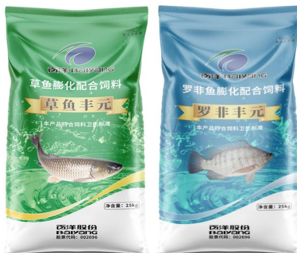
公司部分普水料产品

公司普通水产饲料产品以罗非鱼料和草鱼料等为代表的淡水鱼饲料为主。产品品质稳定，高中低档次齐全，适应不同市场不同客户群体选择。