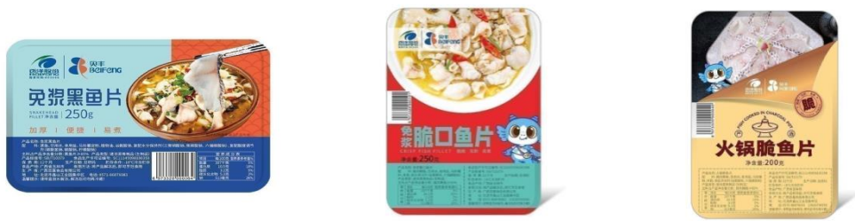
公司“贝丰”品牌部分产品

“俏渔家”系列产品已拥有免浆带皮巴沙鱼片、免浆去皮巴沙鱼片、免浆黑鱼片、免浆鲷鱼片、青虾仁、水煮汉虾等品种。