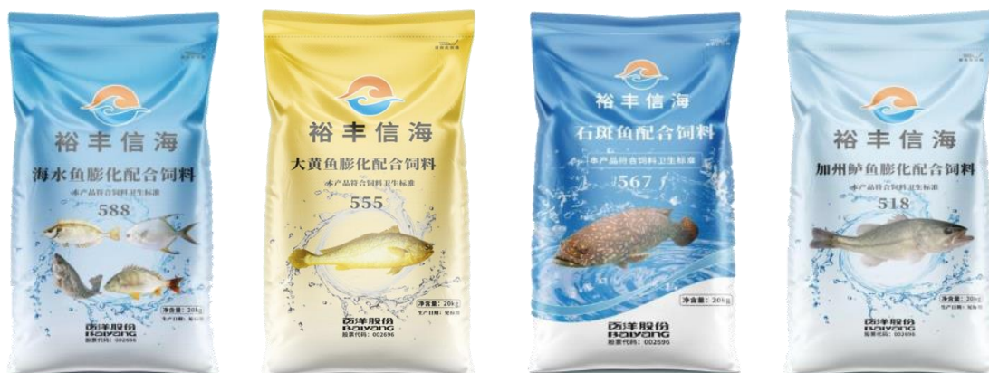
公司部分特种水产饲料产品

等鱼种的系列产品，还配套研发“肝肠丰元”系列产品用于改善鱼类肝脏问题，促进肠道发育。此外，公司还有少量的蛙类饲料产品。