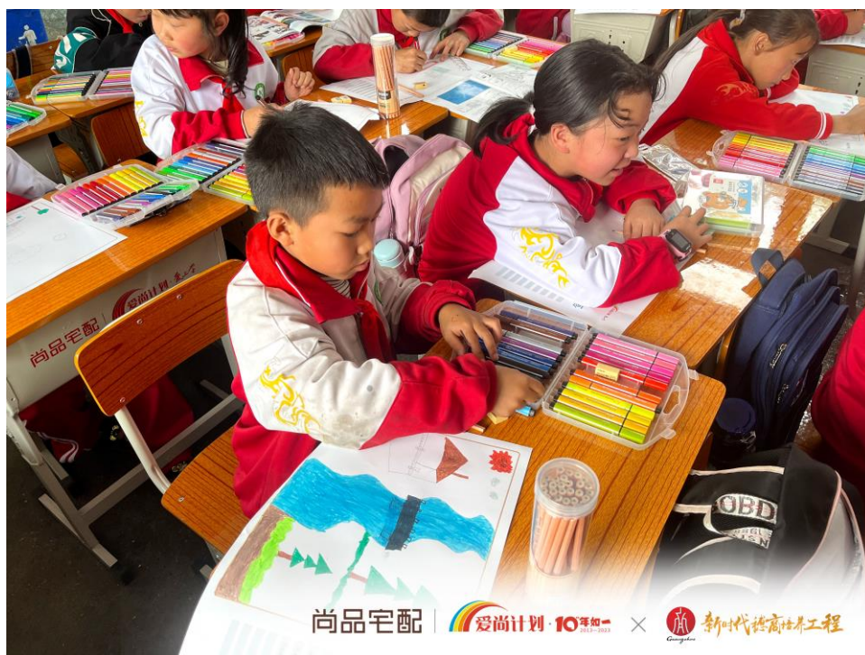
图4：“爱尚计划·爱上学”10周年第一站

2023年3月10日，“爱尚计划·爱上学”开启十周年第一站，携手“新时代穗商培养工程”，走进贵州省毕节市织金县黑土小学，为孩子们送去460套课桌椅、10张讲台，以及图书、学习文具、文体用品等多项物资。