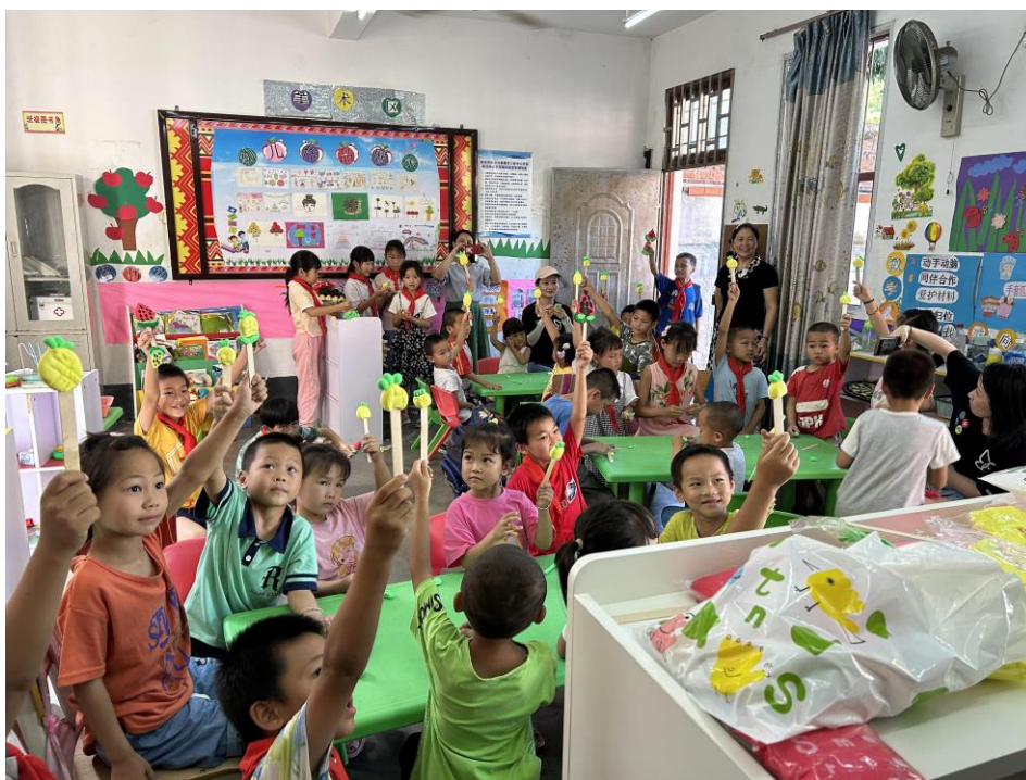
图10：“心意行动·爱读书”互动现场

2023 年 12 月 15 日，“心意行动·爱读书”走进湖南邵阳市隆回县红光小学、临江小学，为孩子们捐赠书吧 17 台、图书 475 册和玩具若干。