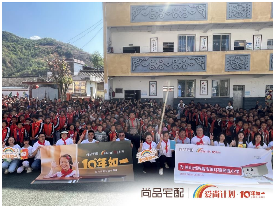
图 5：“爱尚计划·爱上学”走进凉山民胜小学

2023 年 4 月 19 日，“爱尚计划·爱上学”携手尚品宅配四川西昌加盟商团队，走进四川凉山民胜小学，为孩子们送去 100 套课桌椅、100 套水彩笔以及 2000 本少儿图书。