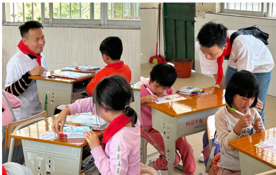
图9：“爱尚计划·爱上学”走进思回小学

尚品宅配 | 爱尚计划·10年如一 2013-2023 | VASTO | 华斯度萤火虫爱心公益行动 FIREFLY CHARITY PROGRAM