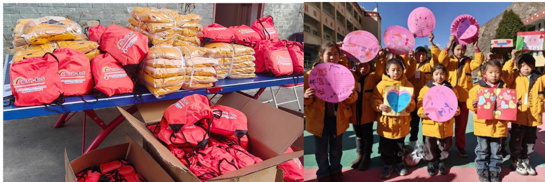
图11：“爱尚计划·衣旧有爱”捐赠现场

一件新衣，让山区孩子温暖过年。“爱尚计划·衣旧有爱”携手华斯度男装·萤火虫公益，筹备 311 件新冬衣，作为新年的第一份礼物，送往四川省阿坝州的 5 所小学，让孩子们快乐度新年。