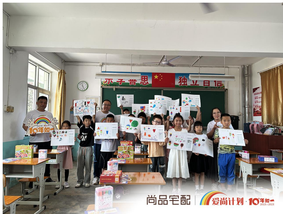
图7：“爱尚计划·爱上学”走进香椿营小学

2023年6月1日，“爱尚计划·爱上学”携手北京尚品宅配公司奔赴河北省香河县五百户镇香椿营小学，为孩子们送去儿童节礼物：200套崭新的课桌椅、6张讲台和200套水彩笔，以及快乐的艺术、体育互动课堂。