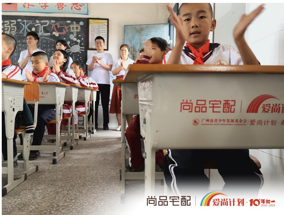
图6：“爱尚计划·爱上学”走进南昌县北联小学

2023年6月1日，“爱尚计划·爱上学”携手北京尚品宅配公司奔赴河北省香河县五百户镇香椿营小学，为孩子们送去儿童节礼物：200套崭新的课桌椅、6张讲台和200套水彩笔，以及快乐的艺术、体育互动课堂。