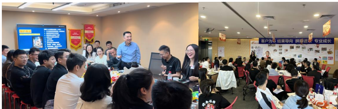
图1：青训营活动现场

针对青年干部培养，公司制定了系统的培养方案，启动了“青年干部训练营”与“中层干部训练营”专项培养项目。通过举办领导力培训、业务技能提升课程等活动，帮助青年干部提升综合素质和管理能力。公司还建立了导师制度，让经验丰富的老干部担任导师，为青年干部提供一对一的指导和帮助。