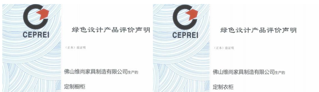
图3：绿色设计产品证明

公司大力推行绿色制造，积极推行清洁生产、加强绿色材料、技术、产品、设备和生产工艺的推广及应用，践行绿色设计理念，加大绿色改造力度，积极创建绿色制造标杆，提升家具行业的对材料的减量化，产品力求能得到高配基因与高标品质。公司先后获批中国专利优秀奖、国家级绿色工厂、绿色供应链管理企业、智能制造示范工厂揭榜单位、国家级工业设计中心、中国绿色产品认证、智能制造试点示范——全屋家居大规模个性化定制、信息化和工业化融合管理体系贯标试点企业等荣誉。