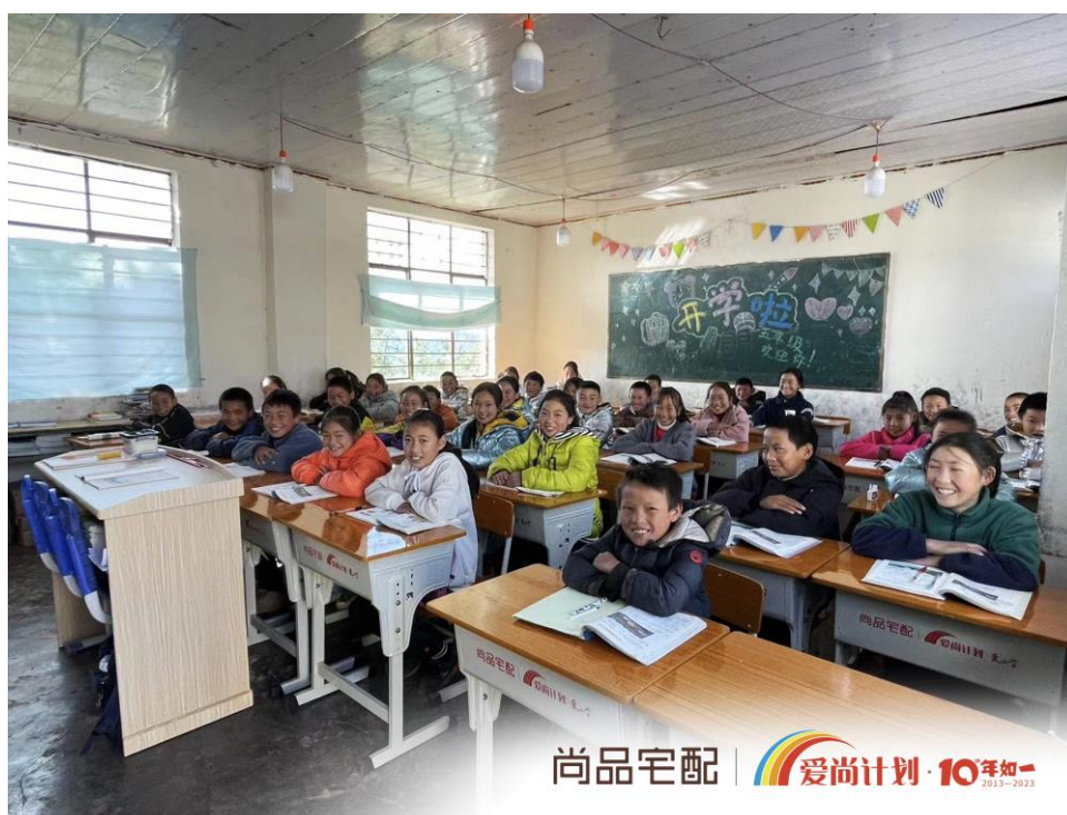
图 8：“爱尚计划·爱上学”走进泛华尔拖小学

2023 年 10 月 30 日，“爱尚计划·爱上学”携手广东优业实业有限公司、深圳市泛华公益基金会，奔赴四川凉山泛华尔拖小学，为孩子们送去 93 套崭新课桌椅、5 张讲台以及 200 份礼物。