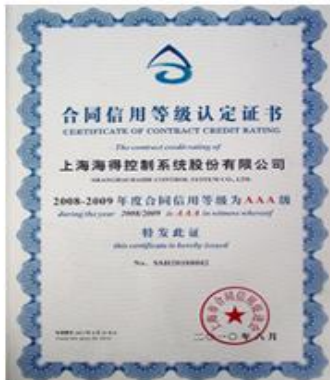
上海市3A级信用企业