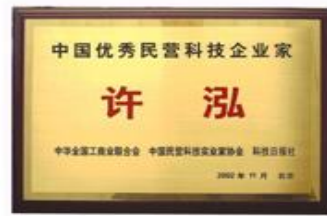
中国优秀民营企业家