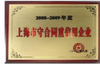
上海市守合同重信用企业