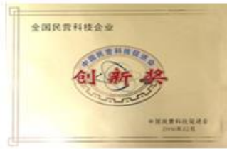
全国民营科技企业创新奖