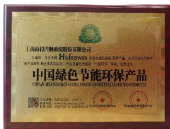
中国绿色节能环保产品