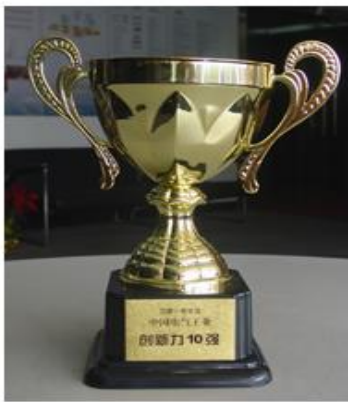
中国电气工业创新力10强