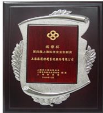
第四界上海科技企业创新奖