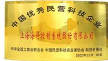
中国优秀民营企业