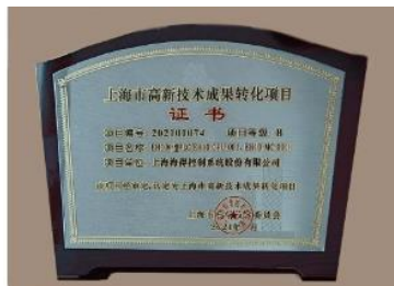
上海市高新技术成果转化项目证书