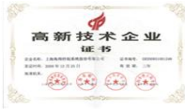
国家高新技术企业