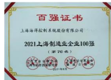
2021上海制造业企业100强