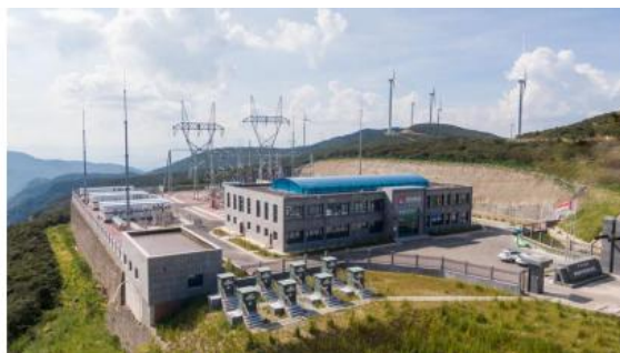
美姑井叶特西升压站