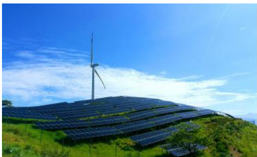
盐边大面山农风光发电互补项目

报告期内，依托控股股东四川能投集团资源优势，积极争取四川省“多能互补”新能源指标，与控股股东所属公司共同组建合资平台，在理塘、马尔康、会东、美姑四地共获取 180 万千瓦新能源指标，正在有序开展项目核准、备案等工作。