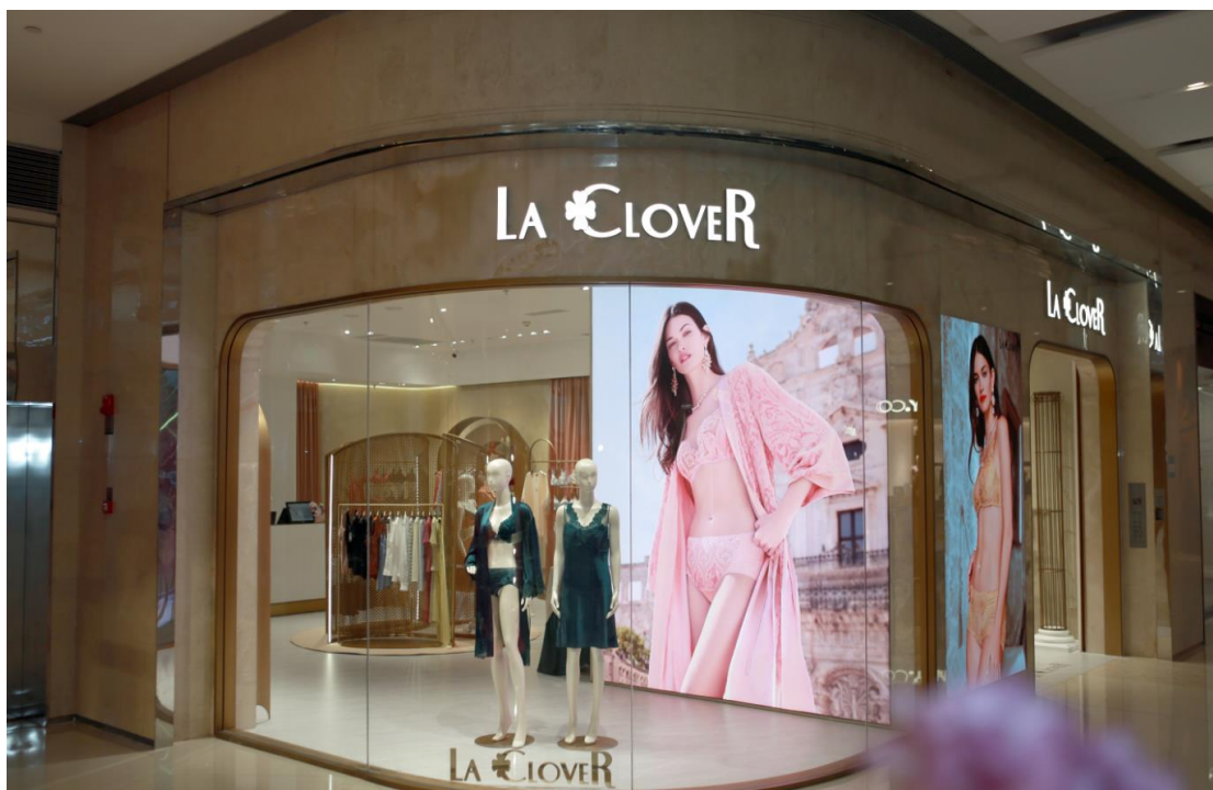
LA CLOVER | 新店铺形象