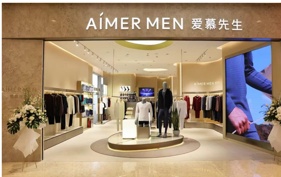
AIMER MEN | 新店铺形象