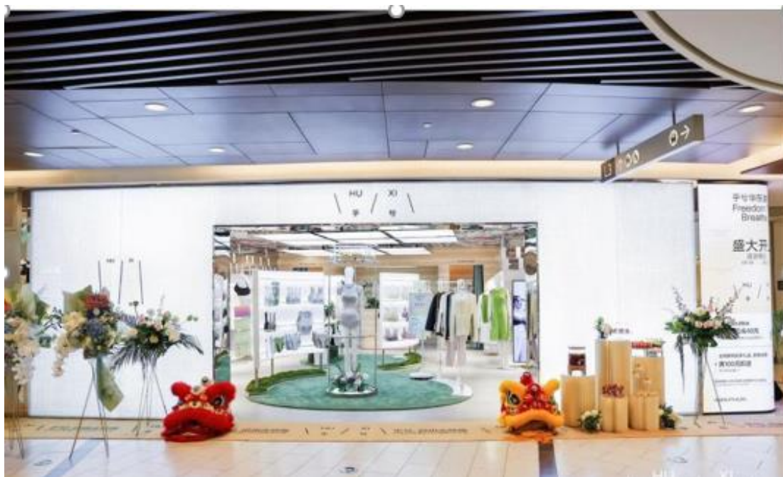
HU XI 乎兮 | 新店铺形象