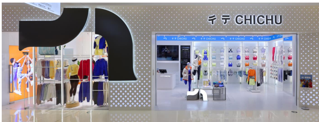
CHICHU 彳亍 | 新店铺形象