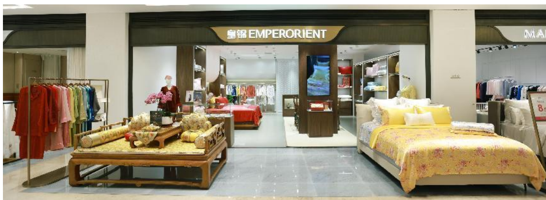
EMPERORIENT 皇锦 | 新店铺形象