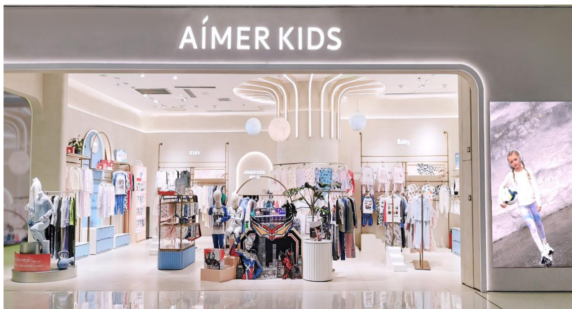
AIMER KIDS | 新店铺形象