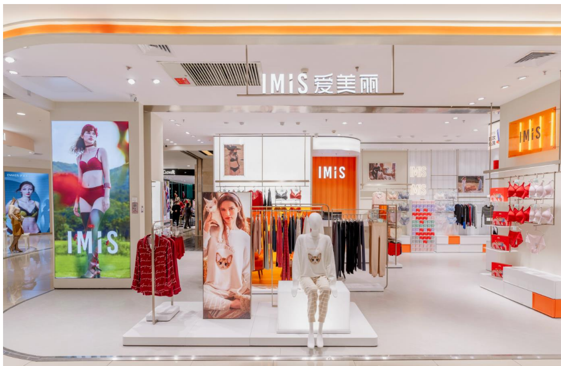
IMIS | 新店铺形象