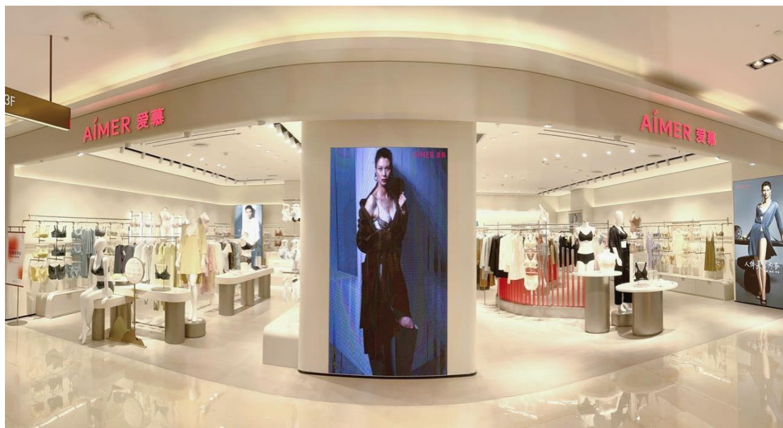
AIMER | 新店铺形象