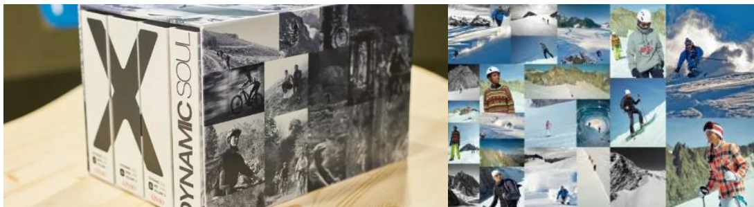
「X DYNAMIC SOUL」功能性纱线产品手册及应用场景图

(2) 户外运动类纱线：2023 年度，公司顺应户外运动市场发展趋势，积极进行技术创新、产品研发，全新升级“X DYNAMIC SOUL”运动集锦，呈现了羊毛服饰在滑雪、徒步、山地骑行和瑜伽四个不同场景的应用，展示了羊毛纱线的多功能性，释放出美丽诺羊毛的运动势能。新澳 SYRO、REMIX 两款产品分别入选 ISPO Textrends Base Layer 类别 Top Ten 和 ISPO Textrends Second Layer 类别 Selection。