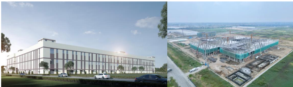
公司越南项目效果图及现阶段施工航拍图

（1）子公司新澳越南“50,000 锭高档精纺生态纱纺织染整项目”正在建设中，项目一期 2 万锭预计今年底至 2025 年建设完成并陆续投产，实现从“产品走出去”到“产能走出去”。