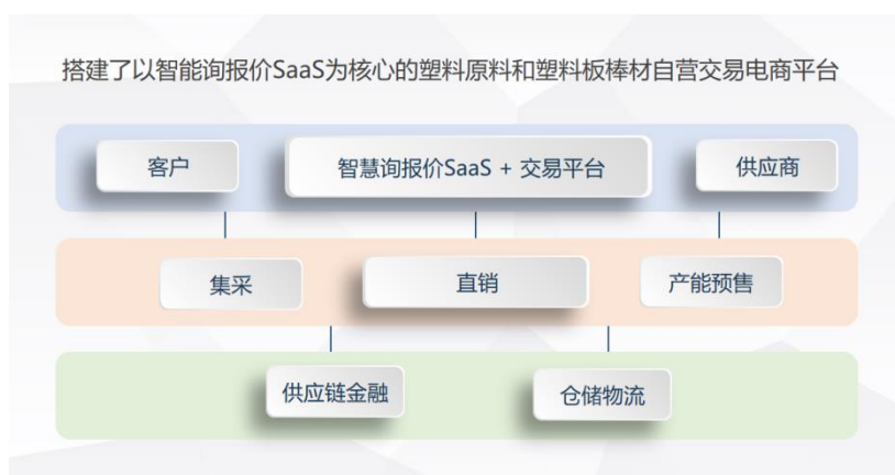
图 3：同益云商业模式