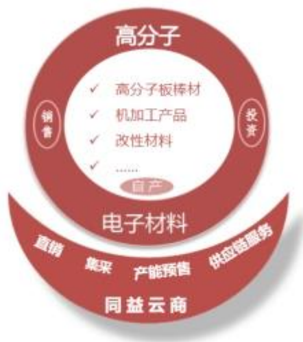
图 4：公司未来发展战略