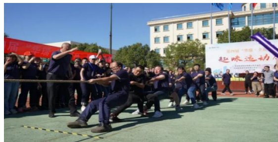
*华瑞员工参加趣味运动会