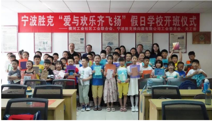
*公司员工子女福利活动