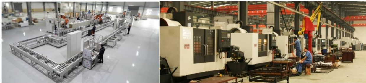
图为公司新能源电机智能生产线、数控自动化加工设备