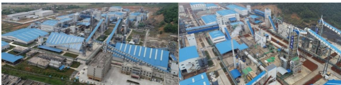
图为银锂新能源厂区俯瞰图

目前，全球锂资源主要聚集在南美锂三角、澳大利亚和非洲等国家和地区，而锂盐及其深加工的产能则多在中国。据中国有色金属工业协会锂业分会统计，2023 年，我国碳酸锂产量 51.79 万吨，同比增幅约为 31.1%；氢氧化锂产量 31.96 万吨，同比增幅约为 30.1%。中国是全球锂盐最主要的生产地，虽然近年来已不断加大对国内锂资源的开发力度，但锂资源仍高度依赖进口，对外依存度高。据海关统计，2023 年，我国进口锂精矿约 401 万吨，主要来源于澳大利亚、巴西、津巴布韦等国，同比增长约 41%；净进口碳酸锂 14.91 万吨，同比增长约 18.6%。