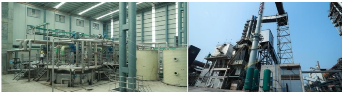
图为银锂新能源产线

部或行业知名企业。锂矿石提炼过程中会产生长石粉、钽铌等其他共生矿产品，长石粉是制造陶瓷、玻璃的重要材料，钽铌应用于国防、航空航天、电子计算机等领域，公司通过对外销售长石粉和钽铌，提高了锂矿石资源的综合利用效率和盈利能力。