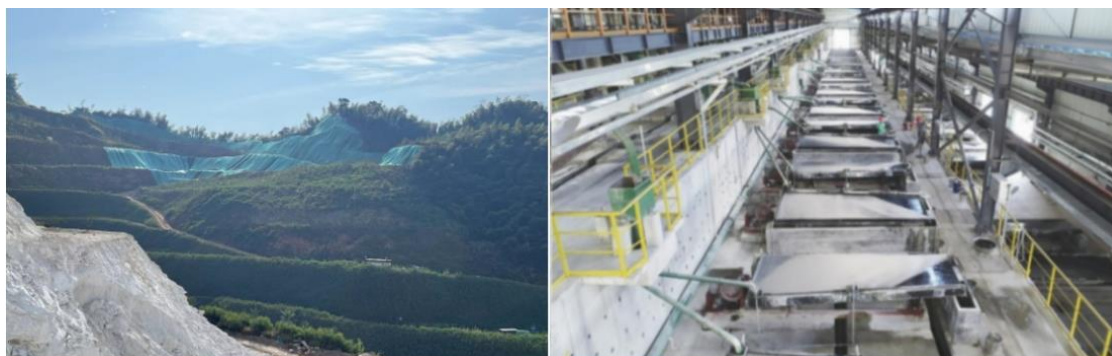
图为公司狮子岭矿山和选矿厂产线

公司主要从事以碳酸锂为主的锂盐产品研发、生产和销售，依托自有锂云母矿山，形成了从锂矿石到锂盐的“采选冶”一体化产业链。江西为全国四大锂矿省份之一，锂云母主要集中在宜春市，宜春市享有“亚洲锂都”的美誉，经过多年的积累和发展，公司在宜春地区现拥有锂瓷石矿 3 处采矿权和 6 处探矿权，3 处采矿权分别为江西省宜丰县狮子岭矿区含锂瓷石矿、宜春市新坊钽铌有限公司钽铌矿和奉新县南方矿业有限公司白水瓷石矿（原采矿证于 2016 年到期，报告期内成功进行了延续并已领取新的采矿许可证），6 处探矿权分别为江西省宜丰县茜坑锂矿、江西省宜丰县牌楼含锂瓷石矿、江西省宜丰县梅家含锂瓷石矿、江西省奉新县坪头岭钽铌矿、江西省宜丰县白水洞-奉新县野尾岭锂矿、江西省宜丰县茅窝锂矿（由茜坑锂矿分立而来）。从已探明矿区储量统计，持有或控制的锂矿资源量 1 亿吨以上，已成为宜春市云母提锂的代表企业。