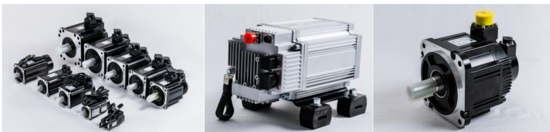
图为公司生产的智能电机

公司创建于 1958 年，距今已有六十多年的历史，是国内最早从事电机制造的厂家之一。凭借过硬的质量和服务，江特电机品牌在行业内一直维持较高的知名度。公司通过自主研发，持续的设备投入和市场开拓，子公司杭州米格的伺服电机位列国内企业出货量前列，原有的建机电机、起重冶金电机、风电配套电机的市场龙头地位得到了进一步的巩固，同时提升了机器人用电机、军工电机、新能源电机、永磁高效电机等的市场占有率，成为国内多个特种电机细分市场的重要供应商。公司多个品类的电机在细分行业连续多年国内产销量排名靠前，其中，风电配套电机的市场占有率位居国内榜首，年销量 10 万台左右，建机电机、伺服电机、步进电机出货量排行国内前列；全资子公司杭州米格生产的伺服电机产品广泛应用于自动化、纺织、机床、物流、新能源、激光等智能制造行业，机器人专用 E/B 系列电机已批量出货并用于焊接、搬运、码垛等行业的国内机器人头部企业；公司还大力参与到海上发电等绿色电网的建设当中，近年来获得了多份海上风电安装船的电机订单；公司与国内军工高校院所合作开发的军工电机，各项指标居于国内领先水平，得到用户的高度认可；另外，公司还参与了一些国家重大项目的建设，如常泰长江大桥、港珠澳大桥、航天工程等。