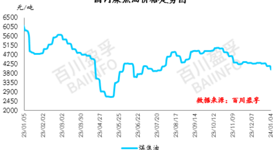
国内煤焦油价格走势