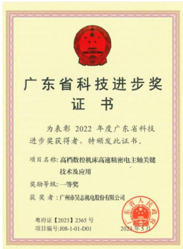
广东省科技进步奖