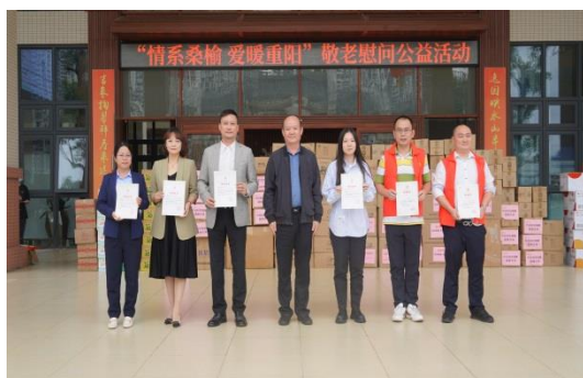
敬老慰问公益活动

公司一直积极承担社会责任，在保证公司持续经营、稳健发展的同时，不忘初心积极地履行企业义务，投身于社会公益事业，更好地与社会共享企业经营成果，公司也将创造更高价值回馈社会。报告期，公司向广州市慈善会、长顺县摆所镇热水村乡村振兴项目等相关单位、项目捐赠15万元以及相关物资两批。