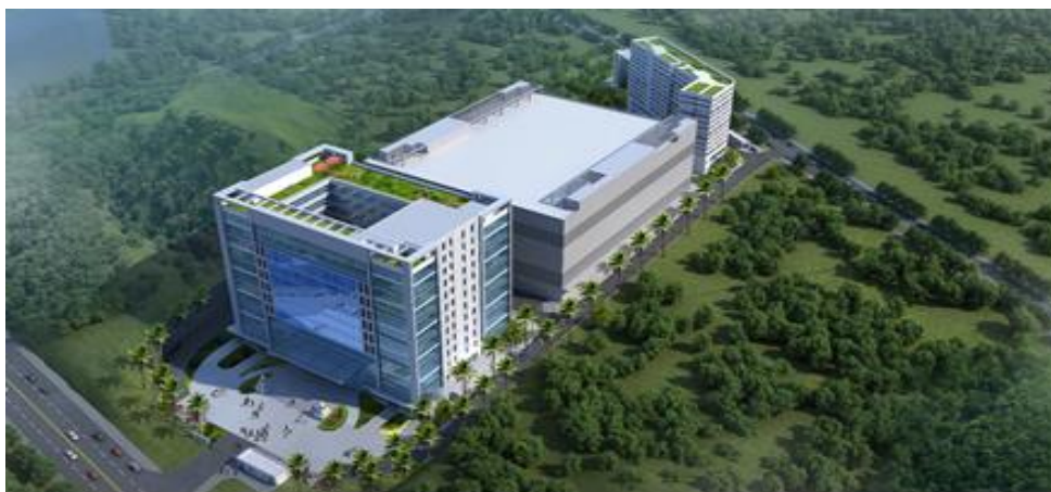
禾丰智能智造基地

公司在广州共有三个生产基地，分别座落于广州市黄埔区禾丰路68号、广州经济技术开发区永和经济区江东街6号和广州市经济技术开发区田园西路41号。2023年，禾丰厂智能智造基地投产，公司将江东厂和田园厂的设备搬迁至禾丰智能制造基地，并购置其他相关设备，从而将禾丰智能制造基地打造成涵盖主轴、转台、减速器、伺服电机等公司现有及拟拓展的各类高端装备核心功能部件的综合性生产制造基地。