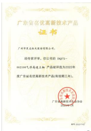
广东省名优高新技术产品—气浮高速电主轴