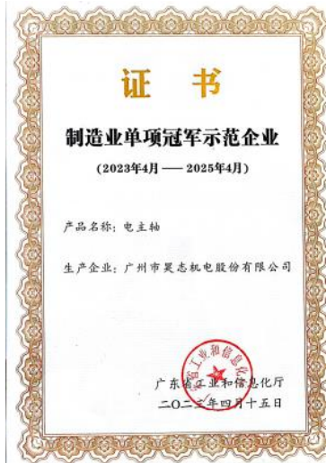
制造业单项冠军示范企业