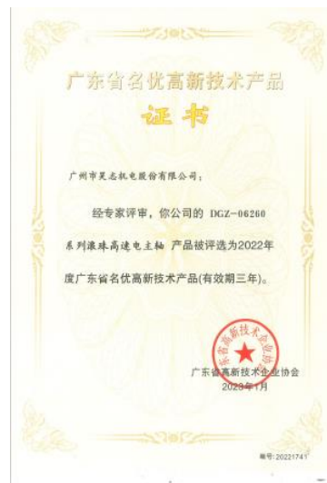
广东省名优高新技术产品—滚珠高速电主轴