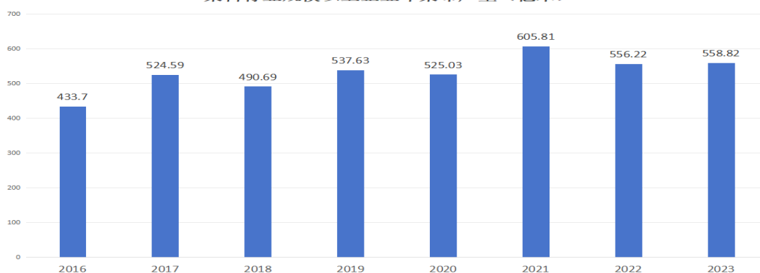
染料行业规模以上企业印染布产量（亿米）

根据国家统计局数据，2023 年，印染行业规模以上企业印染布产量 558.82 亿米，同比增长 1.30%。2023 年下半年印染行业生产逐步恢复，印染布产量逐月提高，纺织服装终端需求持续回暖，印染行业生产恢复向好。