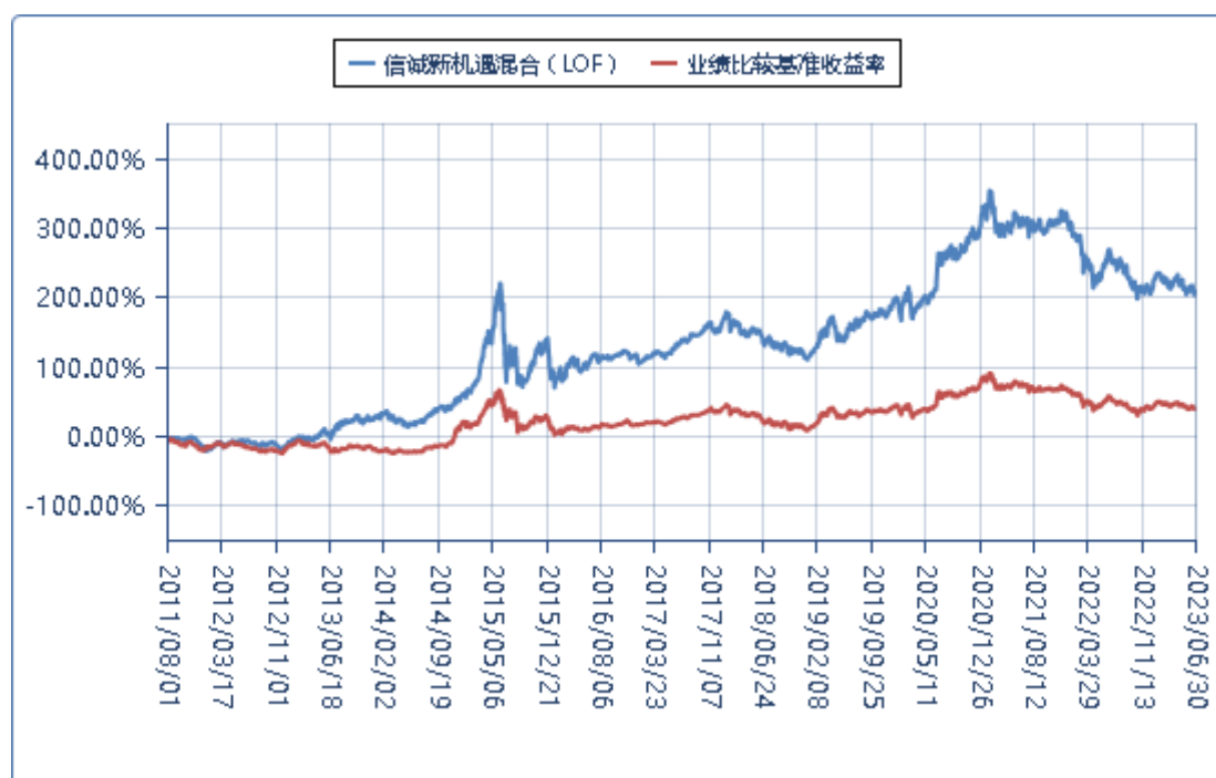
(二) 基金累计净值增长率与业绩比较基准收益率的历史走势对比图