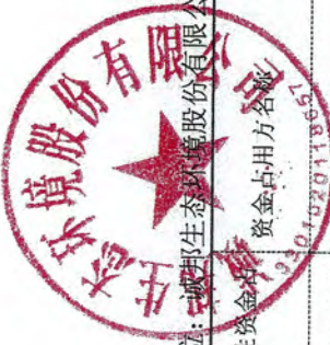
附表：2023年度非经营性资金占用及其他关联资金往来情况汇总表