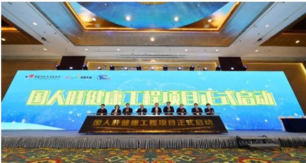
图：国人肝健康工程正式启动

①公司核心产品肝癌三项（AFP、AFP-L3%及DCP）：作为“十三五”国家科技重大专项成果，打破国外垄断，填补国内空白；甲胎蛋白异质体比率（AFP-L3%）和异常凝血酶原（DCP、PIVKA-II），均为国内首个研发成功并上市销售产品。其中，基于“糖捕获技术”的甲胎蛋白异质体比率检测试剂采用磁微粒化学发光法实现全自动高通量检测，达到300T/小时，且达到600T/小时的更高通量的全自动化学发光仪（C6000）也已经上市。