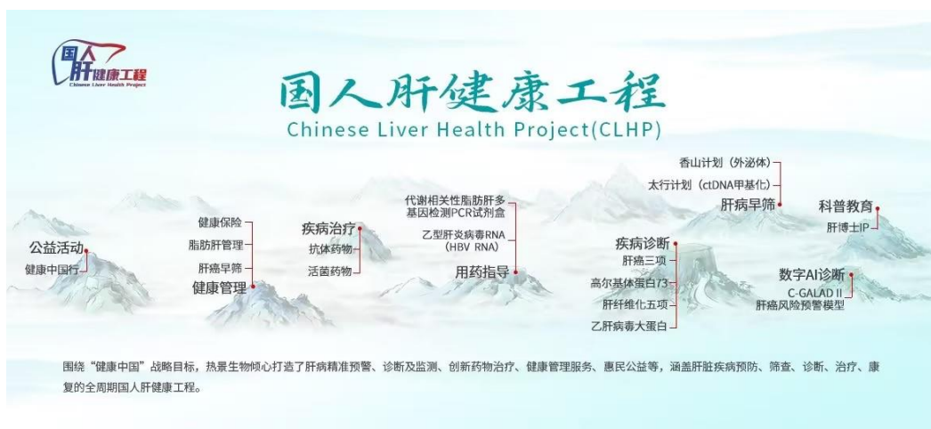
图：热景生物国人肝健康工程

公司聚焦国人肝健康，围绕肝病领域深耕多年，已打造国内唯一的从肝炎到肝癌诊断全流程肝健康管理平台。疾病诊断及早期筛查包括肝癌三项（AFP、AFP-L3%及 DCP）、GP73、肝纤五项、乙肝病毒大蛋白、ctDNA 甲基化和外泌体；肝病预警包括数字智能 AI 诊断模型——C-GALAD II 肝癌风险预警模型；用药指导包括 HBV RNA 和脂肪肝检测试剂盒。公司与中国肝炎防治基金会和中国健康促进基金会联合成立“国人肝健康工程”，结合健康中国行公益活动、科普教育等，全面打造“国人肝健康工程”。