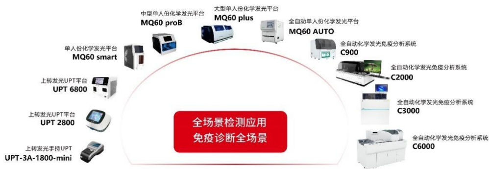
公司全场景免疫诊断平台示意图

公司全场景免疫技术平台进一步完善，建立了从高精度上转发光 POCT（UPT 系列，UPT-3A-1800-mini、UPT-3A-1800、UPT2800、UPT6800）到小型、中型、大型及全自动单人份化学发光平台（MQ60 系列，包括 MQ60 smart、MQ60 Pro B、MQ60 Plus、MQ60 AUTO），到小型全自动化学发光平台（C800、C900），再到大型全自动化学发光平台（C2000、C3000、C6000）已经成为业内为数不多的产品涵盖全场景应用的供应商之一。