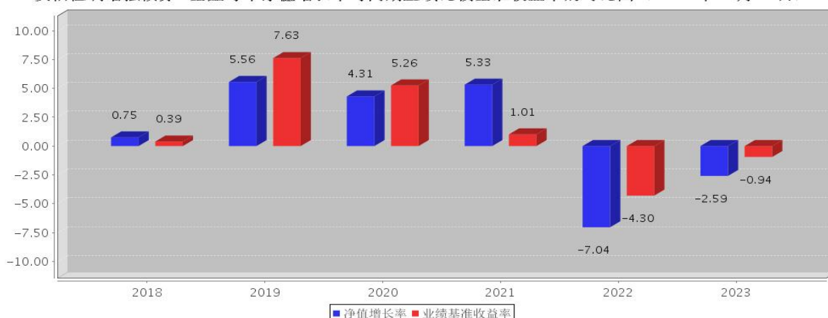
安信恒利增强债券A基金每年净值增长率与同期业绩比较基准收益率的对比图（2023年12月31日）

注：基金合同生效当年期间的相关数据按实际存续期计算，基金的过往业绩并不代表其未来表现。