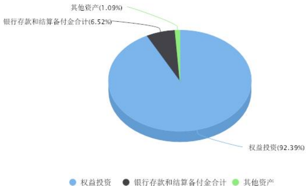
投资组合资产配置图表 数据截止日期:2023年12月31日