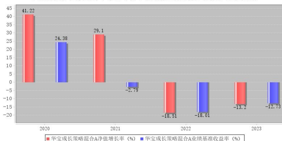
华宝成长策略混合A每年净值增长率与同期业绩比较基准收益率的对比图