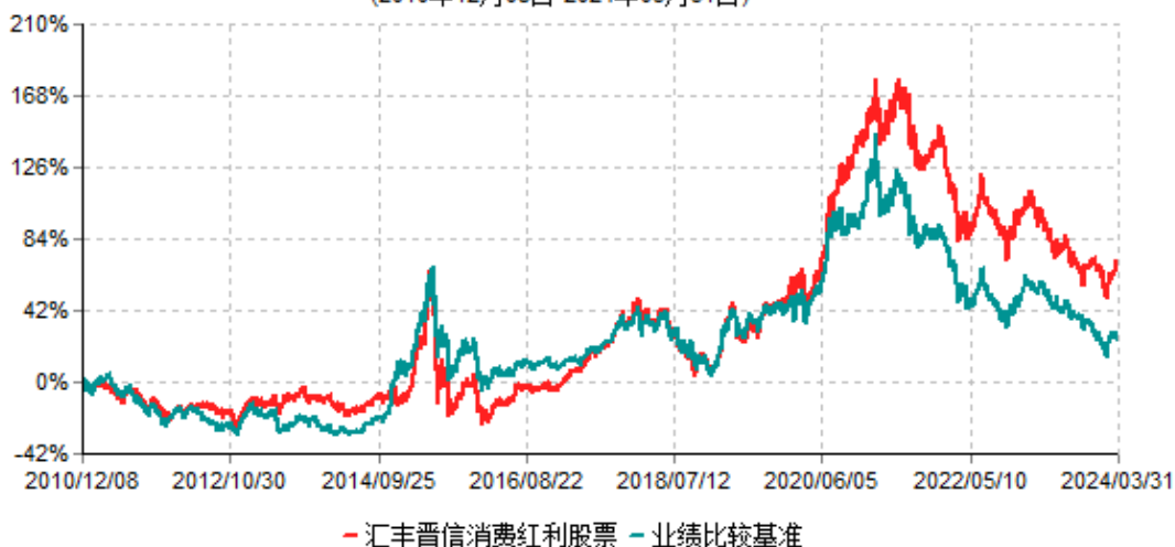
汇丰晋信消费红利股票型证券投资基金累计净值增长率与业绩比较基准收益率历史走势对比图 (2010年12月08日-2024年03月31日)

注：1.按照基金合同的约定，本基金的投资组合比例为：股票投资比例范围为基金资产的85%-95%，权证投资比例范围为基金资产净值的0%-3%。固定收益类证券、现金和其他资产投资比例范围为基金资产的5%-15%，其中现金（不包括结算备付金、存出保证金、应收申购款等）或到期日在一年以内的政府债券的投资比例不低于基金资产净值的5%。按照基金合同的约定，本基金自基金合同生效日起不超过6个月内完成建仓，截止2011年6月8日，本基金的各项投资比例已达到基金合同约定的比例。