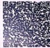
生俊顺年检二维码

本证书经检验合格，继续有效一年。 This certificate is valid for another year after this renewal.