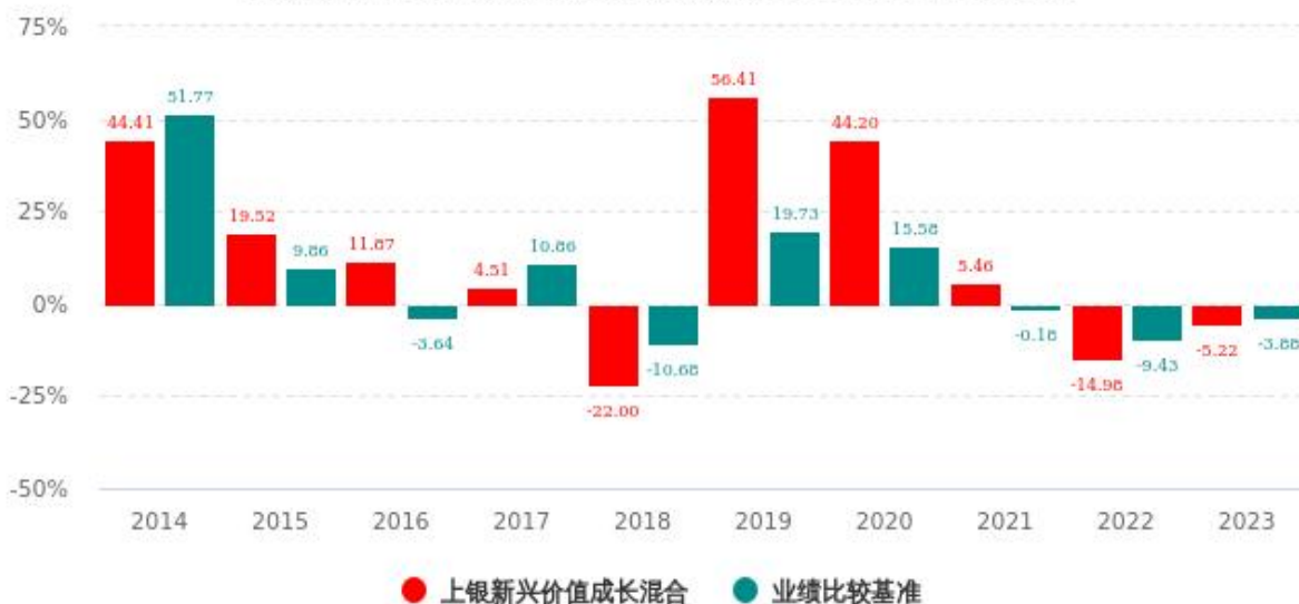
基金的过往业绩不代表未来表现，数据截止日：2023年12月31日