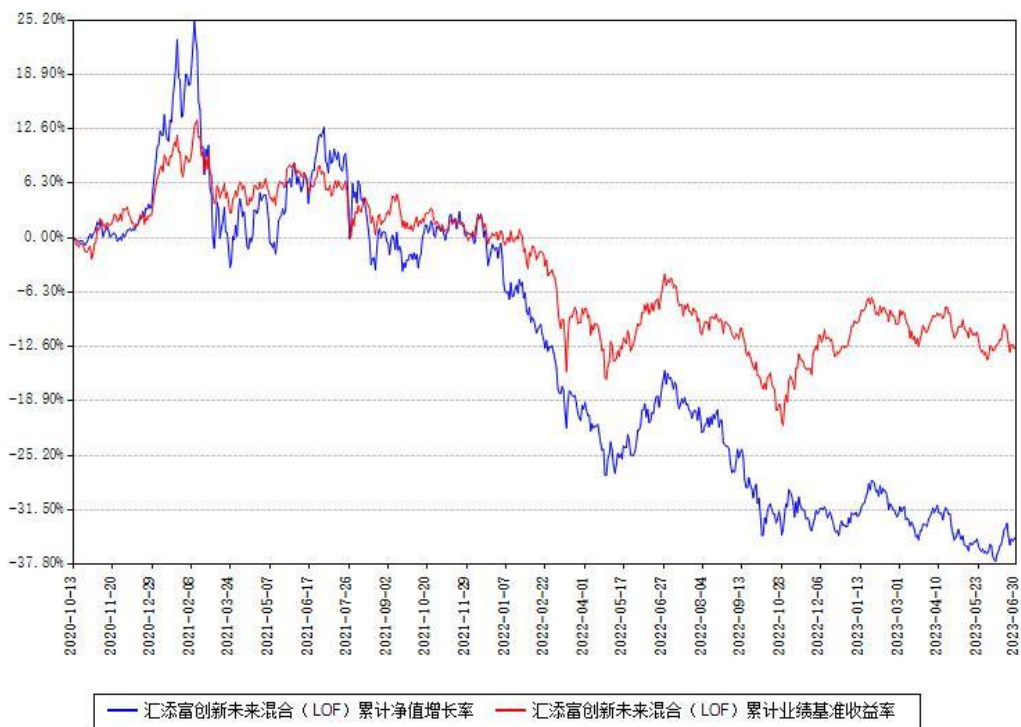
汇添富创新未来混合（LOF）累计净值增长率与同期业绩基准收益率对比图