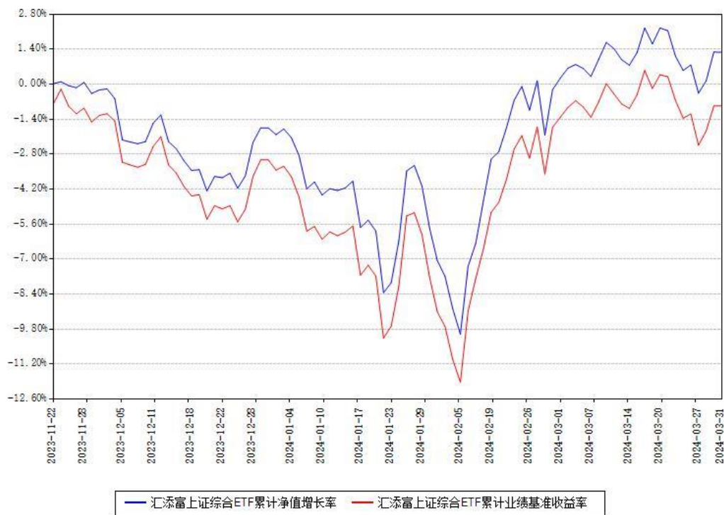
汇添富上证综合ETF累计净值增长率与同期业绩基准收益率对比图