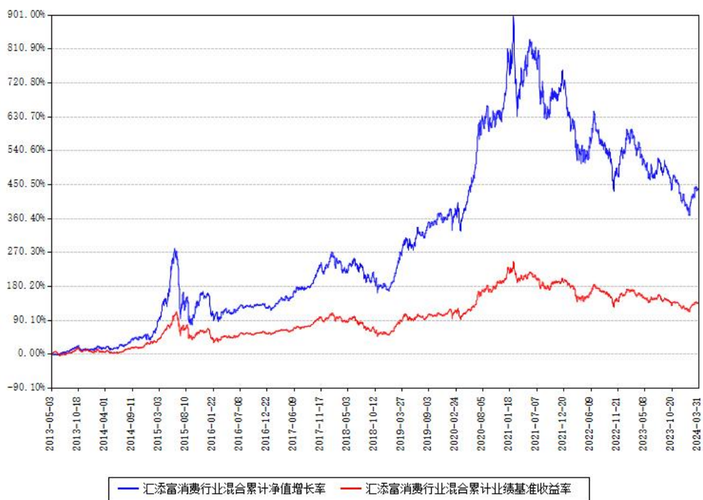
汇添富消费行业混合累计净值增长率与同期业绩基准收益率对比图