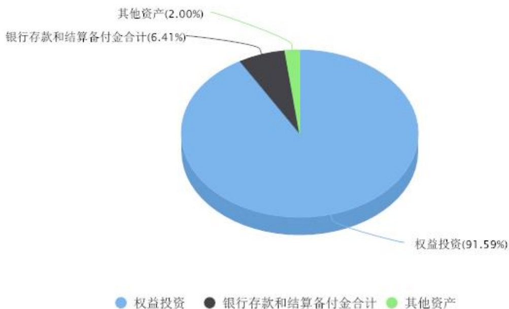
投资组合资产配置图表 数据截止日期:2024年03月31日