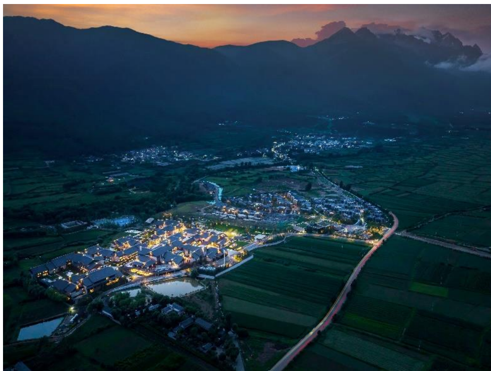
（图：丽江市 Club Med 国际度假酒店项目）