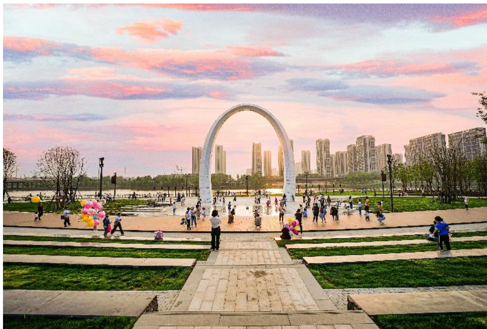
（图：信阳市潢川县光州公园项目）

对于施工总承包项目，公司实行工程项目全生命周期的成本控制。施工前，公司与客户进行沟通，了解项目的实际情况和需求，根据客户的要求和实际情况，制定施工方案和管理计划，并进行成本预测，确认计划成本。施工过程中，公司派遣专业的技术团队进行现场管理和监督，合理安排各专业施工工序，避免交叉施工产生成本浪费。项目完工后，公司及时协调客户进行竣工验收，加快推进项目进入养护期，以有效控制养护成本。同时公司采取措施加快推进结算工作，加速剩余资金回笼，保证项目现金流，减少资金成本。