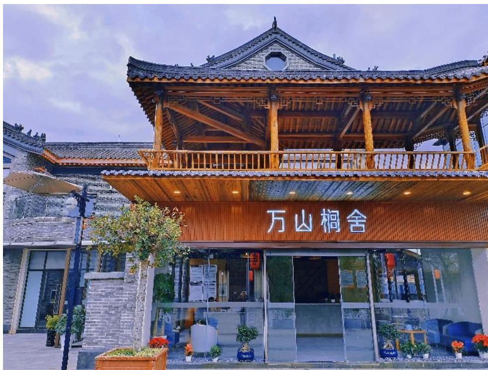
(图：万山桐舍精品民宿)