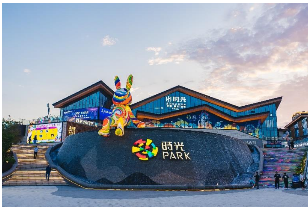
(图：江西上饶时光 park 项目)