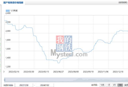
2023 年度焦煤价格走势